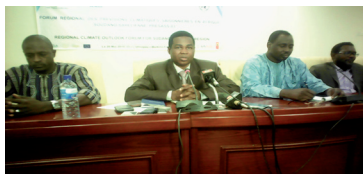
DG de la METEO au milieu