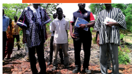
Visite du bas-fonds