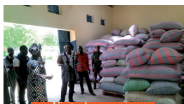
Visite du magasin