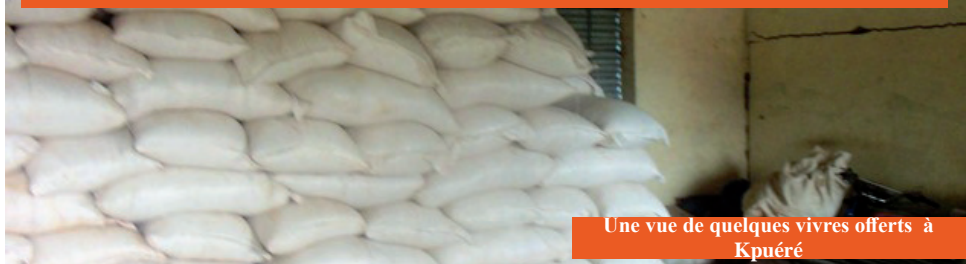
Une vue de quelques vivres offerts à Kpuéré

La Ministre de la Femme, de la Solidarité Nationale et de la Famille Laure ZONGO /HIEN en compagnie du Gouverneur de la région du Sud-Ouest Ambroise Stanislas Amadou DIARRA et d'une forte délégation ministérielle est allée remettre des vivres aux retournés forcés de Bouna se trouvant sur les sites d'accueil de Batié et de Kpuéré. C'était dans la journée du lundi 6 juin 2016 sur la place de la mairie de Kpuéré et au Centre communautaire de Batié.