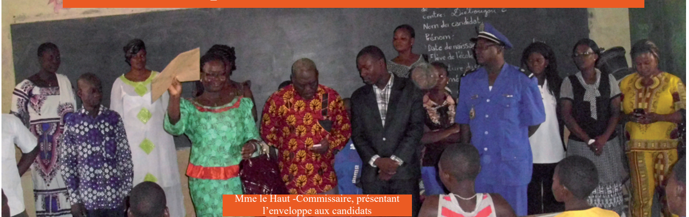
Mme le Haut -Commissaire, présentant l'enveloppe aux candidats