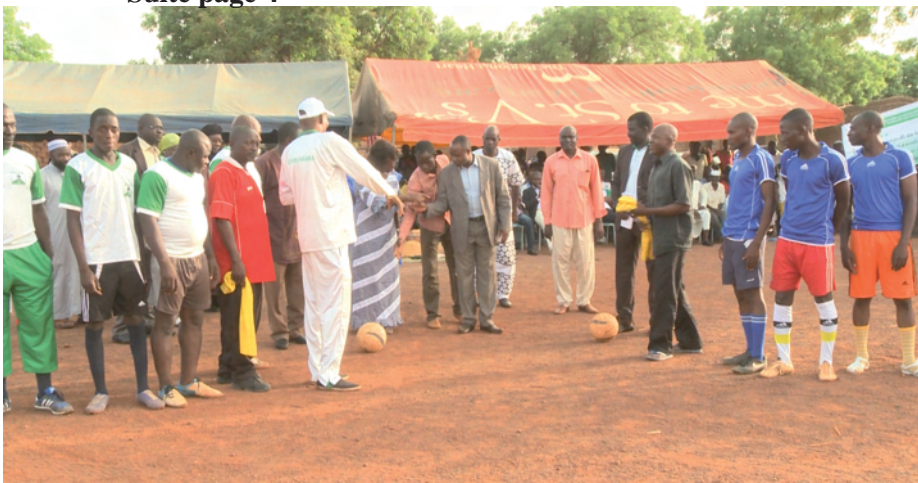
Coup d'envoi du match

des comités d'action communautaire (CNCAC-BF) a voulu rassembler la jeunesse notamment celle des partis politiques ayant compétit pour l'élection des conseillers municipaux dernièrement autour d'un objectif commun : le développement.