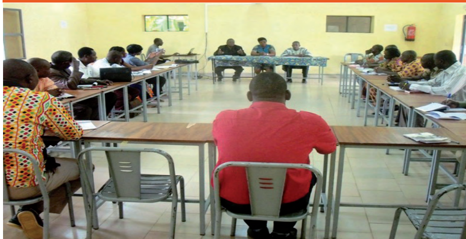
Les participants échangeant sur les grossesses en milieu scolaire

Une rencontre d'échanges pour faire un plaidoyer sur les grossesses non désirées ou précoces en milieu scolaire, a été organisée par la Fondation pour l'Etude et la Promotion des Droits Humains en Afrique (FEPDHA), dans la journée du vendredi 24 juin 2016 dans la salle de conférence de la Maison