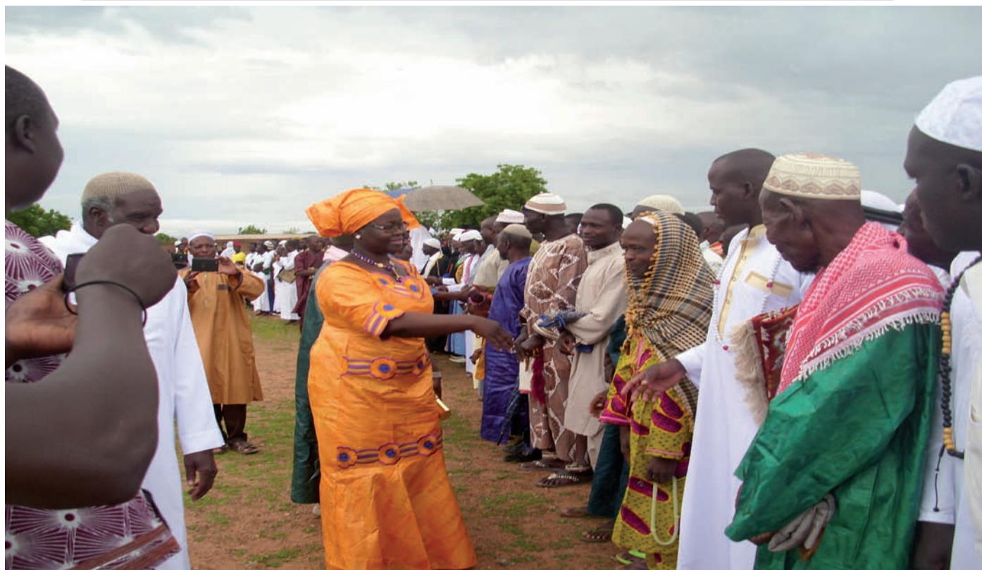
Mme le Haut-Commissaire et sa suite, saluant la communauté musulmane.

l'union dans la fraternité, la communion et cette vision ultime : la Paix et le Développement.