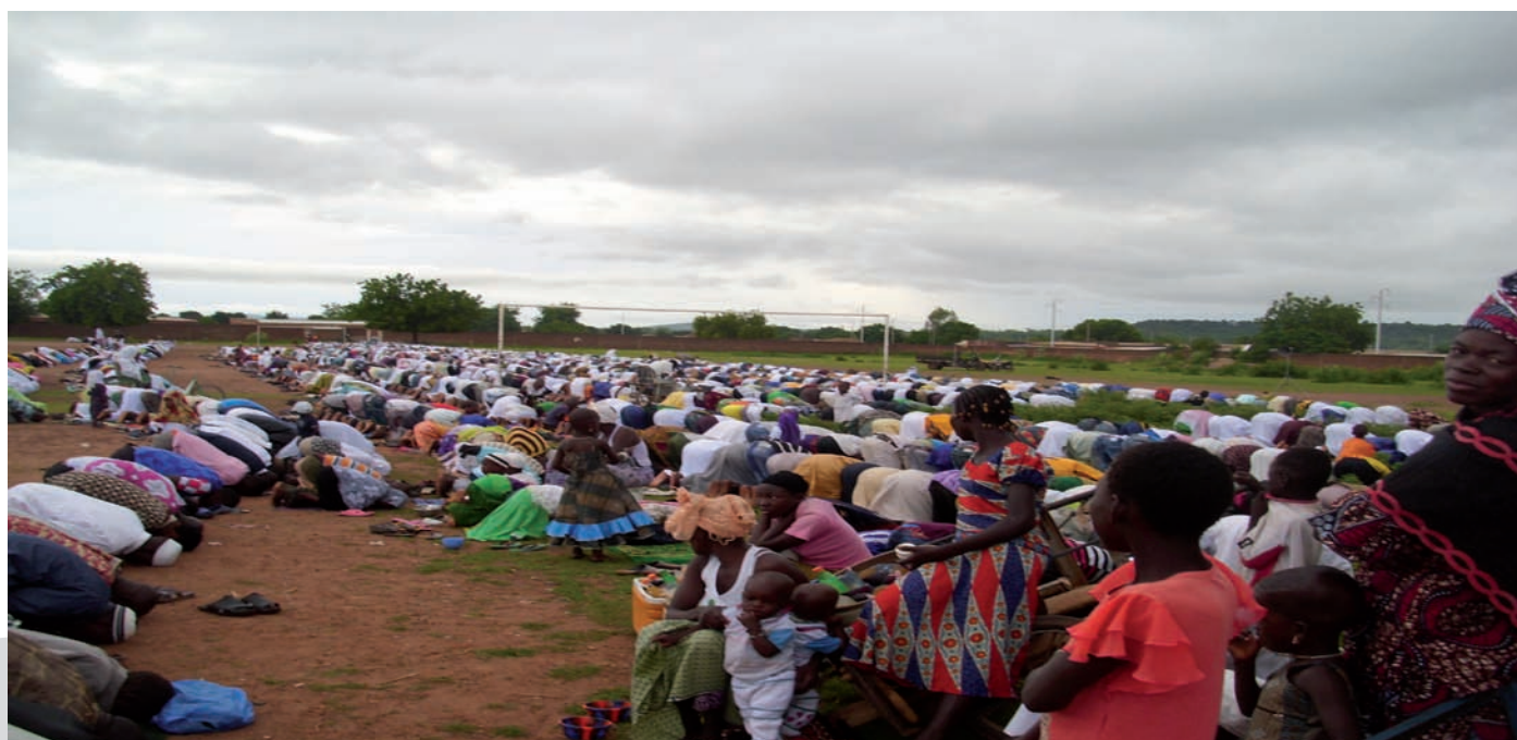
Les fidèles musulmans ont prié en communauté