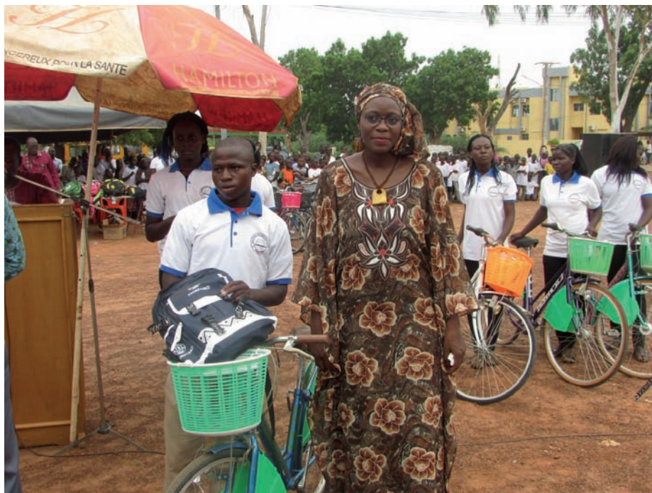
Le meilleur élève au BEPC de la région du plateau-central.

A l'endroit des enseignants, elle dit manquer de mots pour leur dire merci. Elle dit prier Dieu pour qu'il les comble de grâce au-delà de leurs attentes. Au nom de ses camarades, elle a promis à leur parrain, le Ministre Eric Bougma des infrastructures de travailler d'avantage ainsi des ministres pourraient être issus de leur promotion dans un futur proche. Elle a profité de l'occasion pour demander au ministre d'user de son influence auprès de ses collègues pour que l'Etat s'occupe mieux des enseignants au-delà de leur mérite car ils sont le socle du devenir du pays a-t-elle précisé.