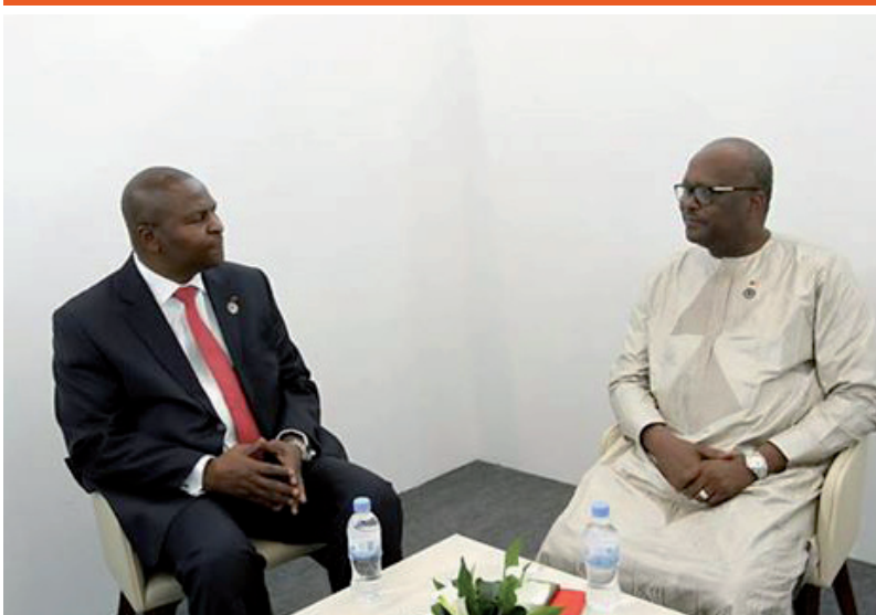
Coopération entre le Burkina Faso et la République Centrafricaine.

En marge des travaux du 27e Sommet de l'Union africaine à Kigali, le Président Roch Marc Christian KABORE a eu un tête-à-tête avec son homologue de la République Centrafricaine, Faustin Archange TOUADERA le lundi 18 juillet 2016.