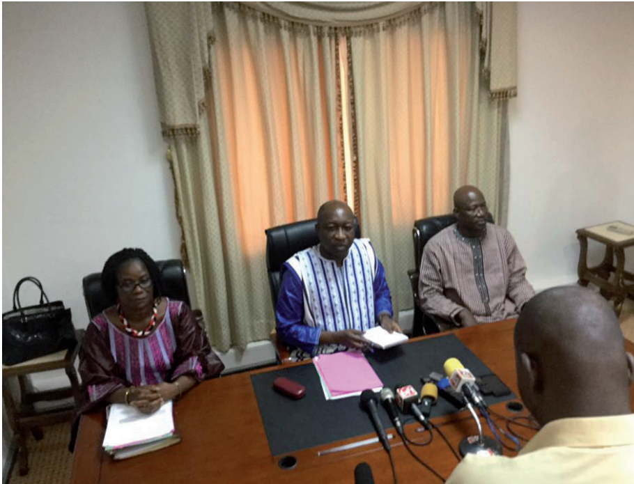
Le Premier Ministre Paul Kaba THIEBA a présidé la session.