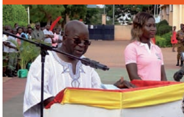
Le ministre Simon COMPAORE

La cérémonie officielle de sortie de la promotion 2016 de l'Ecole Nationale des Douanes est intervenue le lundi 11 juillet à Ouagadougou. « Faire le travail pour lequel vous avez été formés, et bien le faire », c'est le conseil prodigué à ces agents par le parrain de cette cérémonie, le ministre d'Etat, ministre de l'Administration Territoriale, de la Décentralisation et de la Sécurité Intérieure, Simon