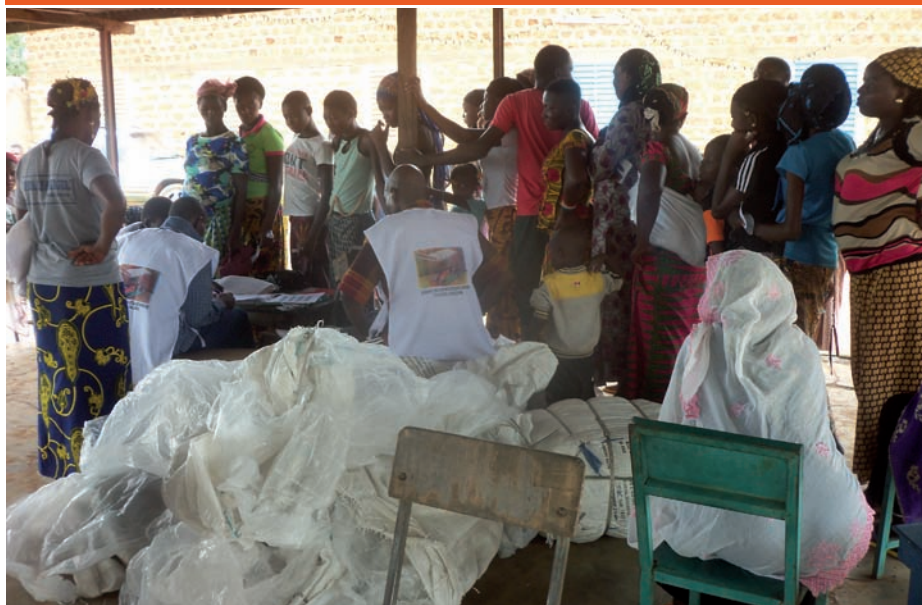
Distribution de moustiquaires imprégnées aux populations.

La commune de Gaoua à l'instar des autres communes du Burkina, a connu la distribution des Moustiquaires Imprégnées d'insecticides à Longue Durée (MILDA) aux différentes couches de la société dans la matinée du vendredi 15 juillet et ce jusqu'au lundi 18 juillet 2016. Hommes, femmes, vieux, jeunes et même enfants étaient tous au rendez-vous.