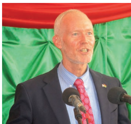
Le Représentant du parrain.

La promotion 2014-2016 des Elèves de l'Ecole Nationale d'Administration et de Magistrature (ENAM), a effectué sa sortie officielle le lundi 18 juillet 2016 à Ouagadougou. C'est en présence du premier ministre Paul Kaba THIEBA et du représentant de l'ambassadeur des Etats-Unis au Burkina Faso respectivement patron et parrain et de plusieurs autorités que s'est déroulée cette cérémonie de sortie de promotion.