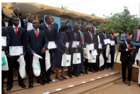
Photo de famille de la promotion sortante.

Après deux ans passés à l'école, le moment est venu pour ces élèves de mettre désormais leurs compétences à la disposition de l'administration burkinabè. Pour mieux accomplir les