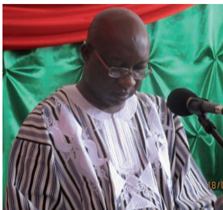
Le Premier Ministre du Faso.