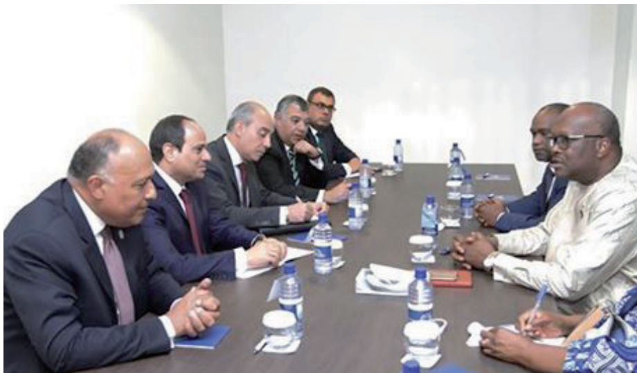
Coopération bilatérale entre le Burkina Faso et l'Egypte.

Le Président Roch Marc Christian KABORE a eu une séance de travail à Kigali le 18 juillet 2016 avec son homologue égyptien Abdel Fatah AL SISSI. Il a été question au cours des échanges, de coopération bilatérale entre le Bur-