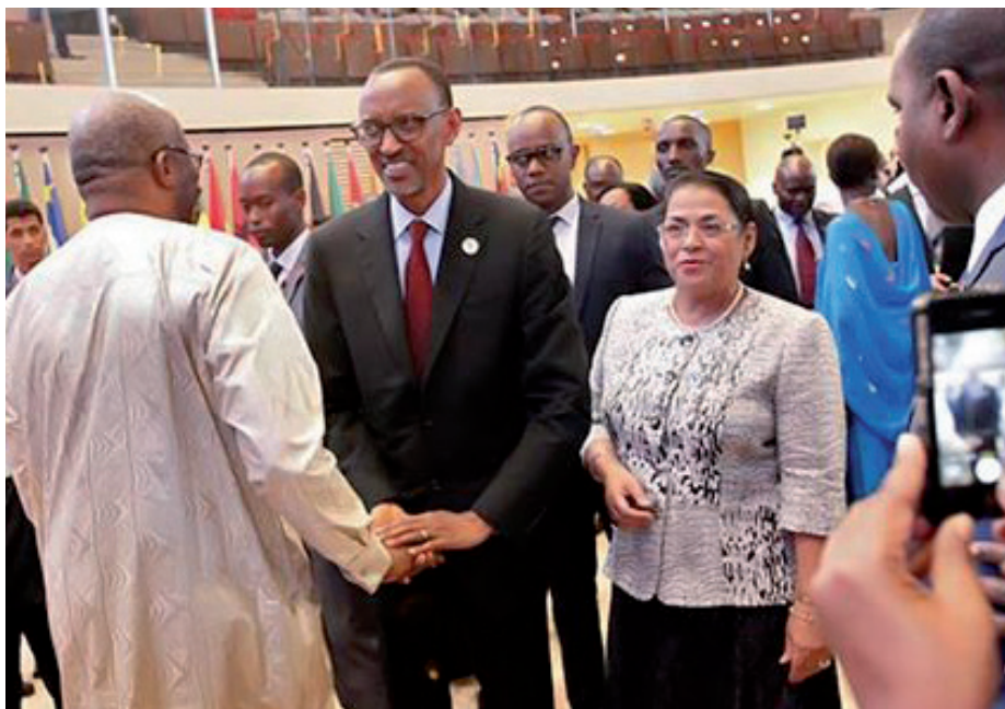
S.E.M Roch Marc Kristian KABORE, saluant son homologue rwandais, Paul KAGAME.

La 27e session des chefs d'Etat et de Gouvernement de l'Union africaine (UA) a clos ses travaux dans l'après-midi du 18 juillet 2016 à Kigali.