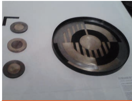
Oeuvre d'art exposé.

L'enjeu de ce projet est d'identifier et de mettre en œuvre des solutions innovantes et durables pour promouvoir l'autonomie de ces réfugiés et leur permettre de retrouver toute leur dignité. Il a pour objectif de structurer et pérenniser l'insertion socio-économique