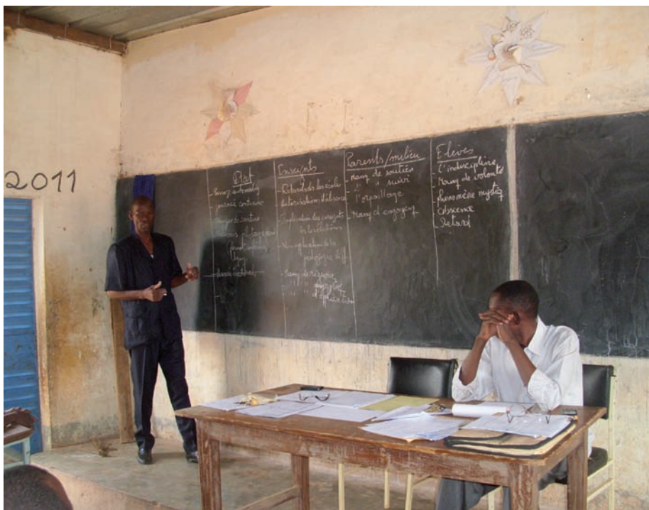
L'inspecteur, craie en main n'a pas hésité à faire avec les enseignants et encadreurs présents, le tour des difficultés et les solutions envisagées pour de meilleurs rendements.

Du côté de l'Etat : les participants ont relevé le passage automatique en classe supérieur, le manque de cantine scolaire ou qui ne vient pas à temps, l'année électorale etc. parmi les difficultés.