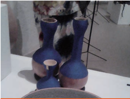
Oeuvre d'art exposé.

L'association Afrikatiss à travers son projet Design for Peace a inauguré le samedi 4 juin 2016 une exposition intitulée Transhumance à l'Institut français. Cette exposition est le fruit du labeur d'artisans maliens réfugiés au Burkina en collaboration avec des Designers français. Les objets exposés y seront jusqu'au 24 juillet 2016.