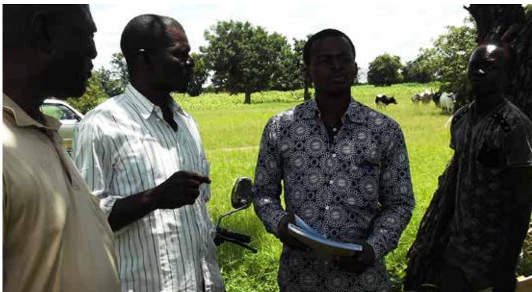
Le Secrétaire Général de la province tenant le document en main.