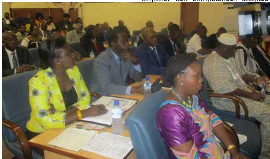
Les participants à la rencontre.