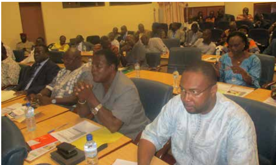
Les participants à la rencontre.

Selon Paul Kaba THIEBA, l'Etat doit créer des conditions favorables pour la réalisation des entreprises. Et ce sont ces entreprises qui doivent créer des emplois. « Le rôle de l'Etat ce n'est pas créer des emplois, c'est le secteur privé » a insisté le ministre. Il a cependant invité le secteur privé à