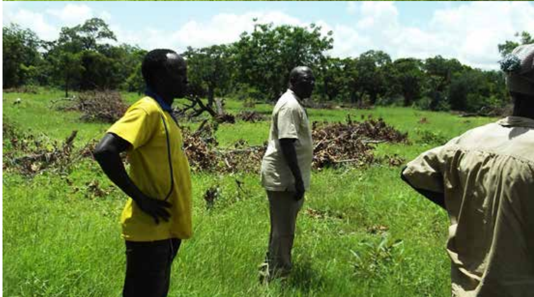
Visite du nouveau site de l'école.