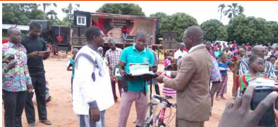
Un lauréat recevant son prix..