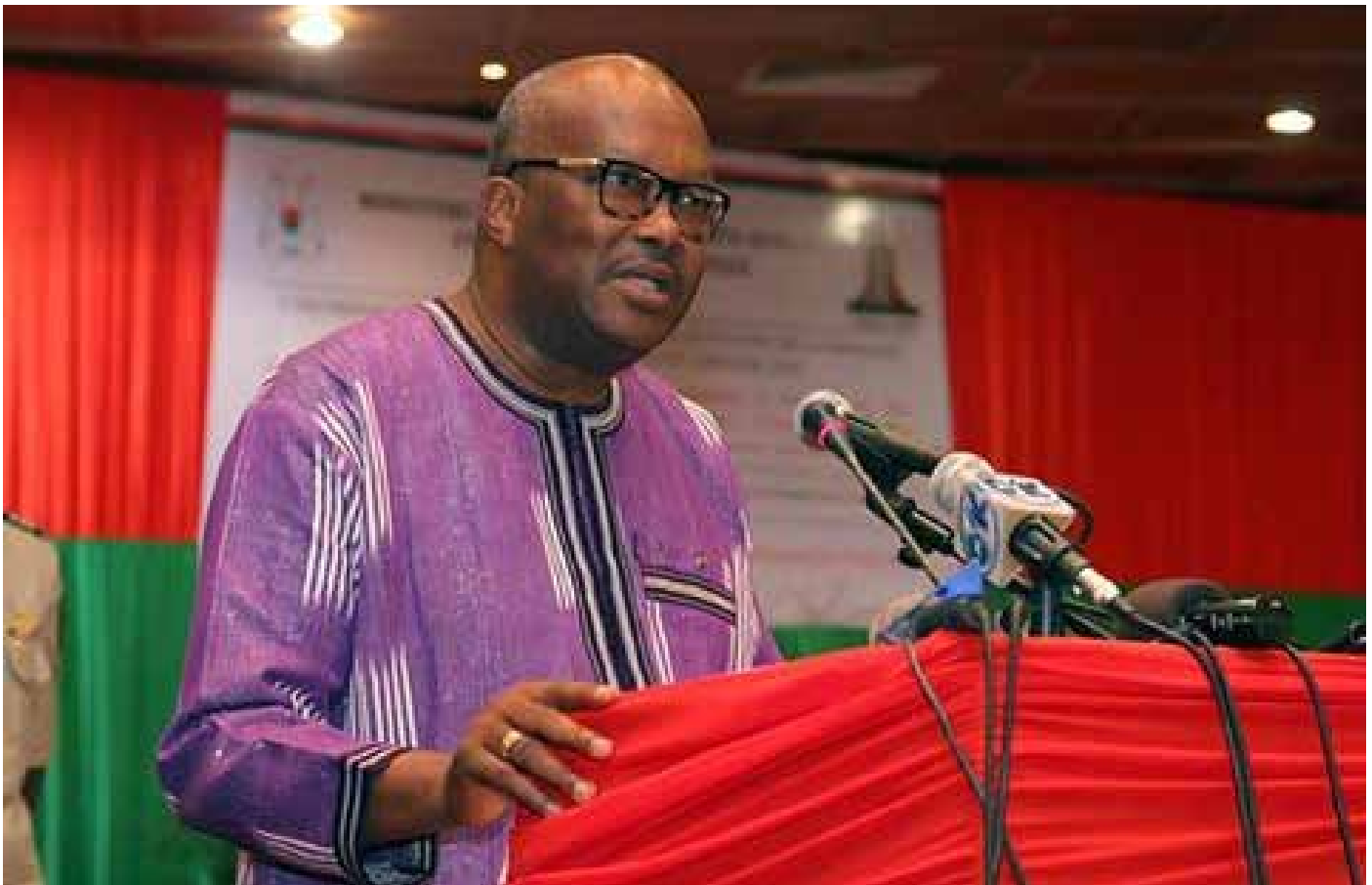
Le Président du Faso prononçant son discours.

E xcellence, Monsieur le Premier Ministre, Chef du Gouvernement