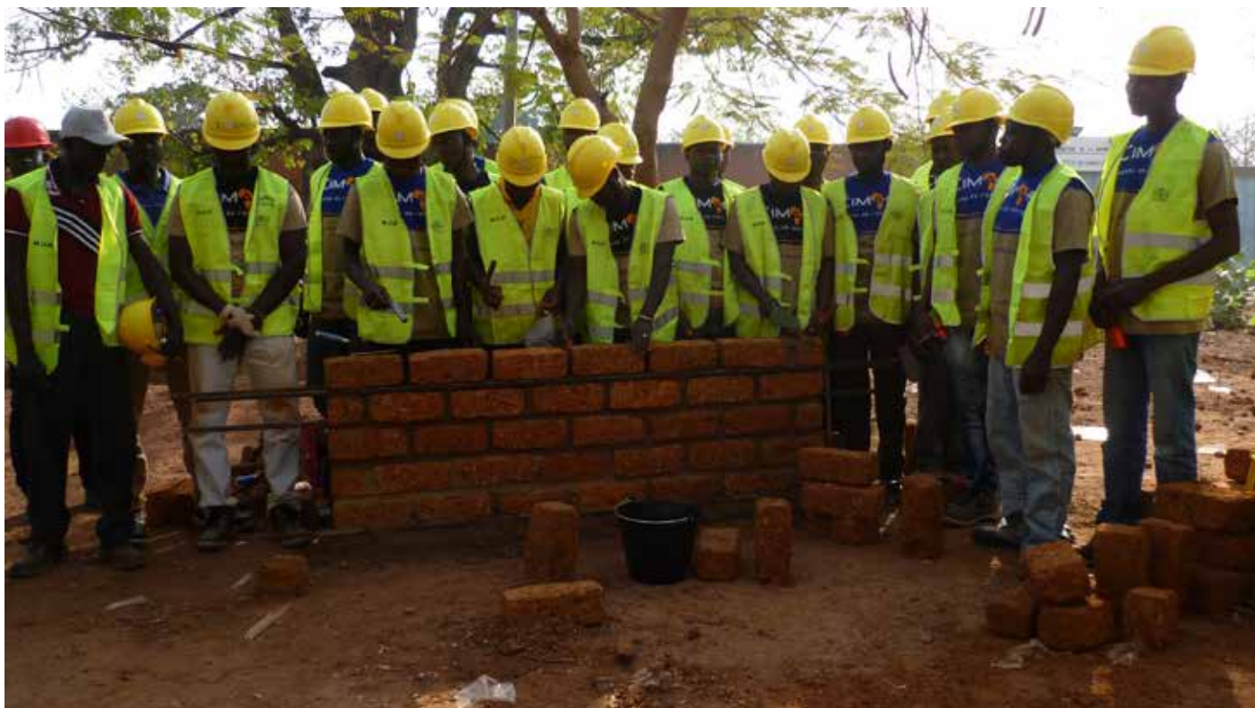
Équipe d'artisans ouvriers en plein exercice de construction.

polyvalente de cinq cents(500)places, un certain nombre d'équipement à savoir un second marché, une seconde gare routière et de bien d'autres réalisations a indiqué le maire Fiacre Kambou.