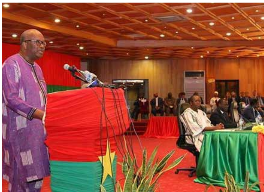
Le Président du Faso à la cérémonie de lancement de la SENAC.

Vous constatez avec moi que l'actualité nationale reste marquée depuis quelques années par une recrudescence et une persistance des