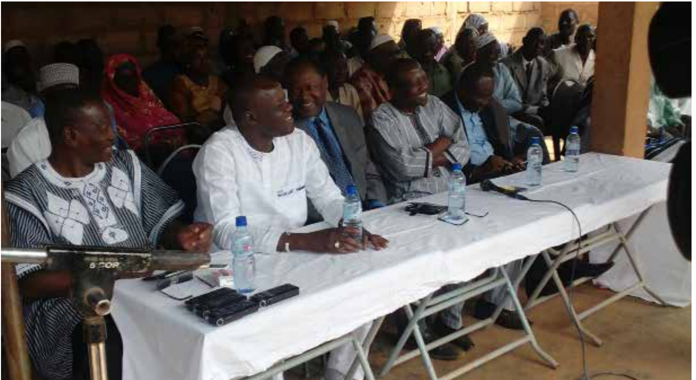
Les responsables de la CODER.

L es membres fondateurs de la coalition pour la démocratie et la réconciliation ont effectué une rencontre avec leurs militants de la cité de Naaba Kiiba ce samedi 10 décembre 2016. C'est vers 9h que la délégation a été accueillie à l'entrée de la ville. À coups de klaxons, de sifflets et de cris de liesse, le cortège a été accompagné chez Sa Majesté Naaba Kiiba au palais royal puis chez les leaders religieux (musulmans et protestants) par des militants sortis nombreux pour la circonstance.