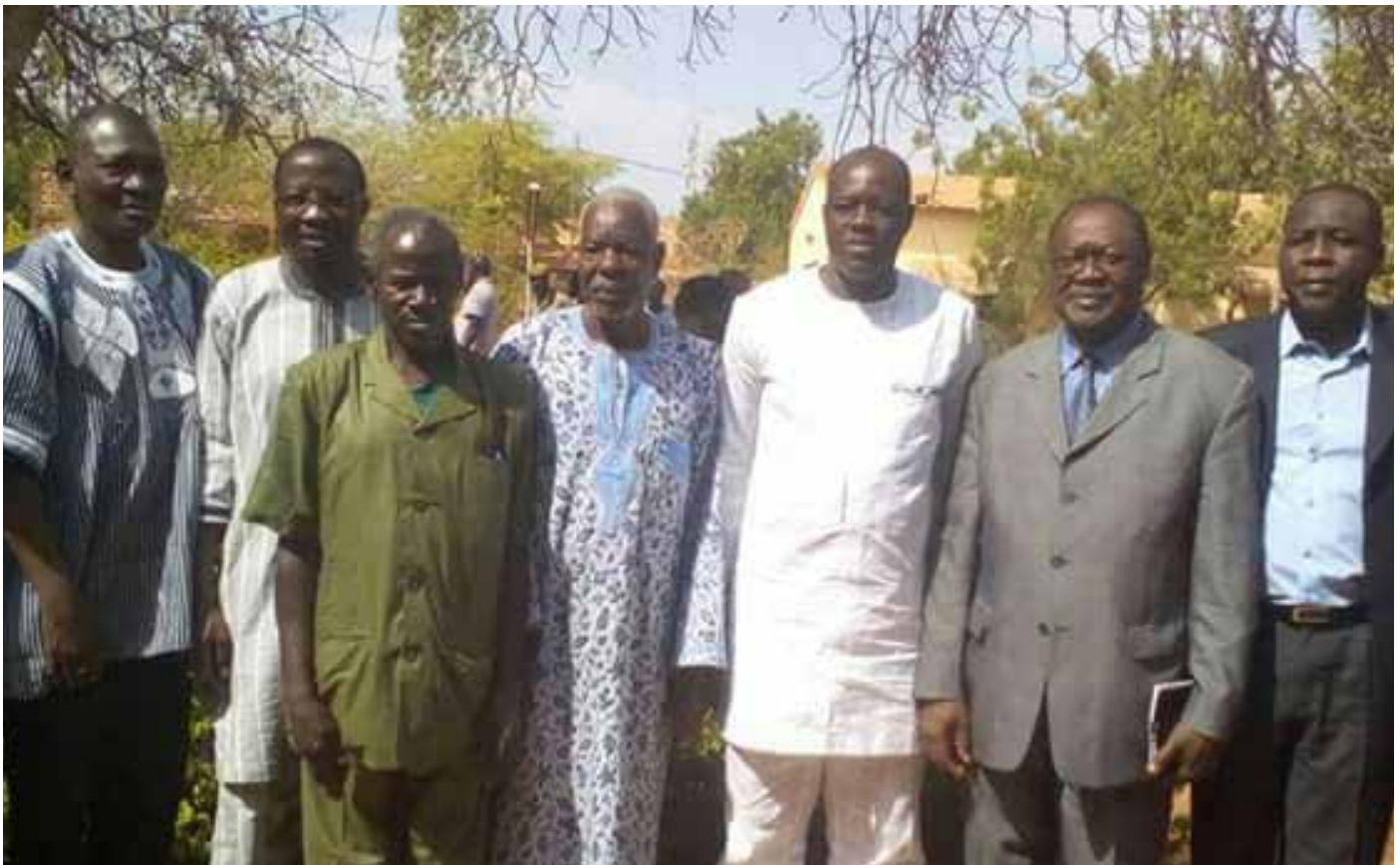
La mission pausant avec les responsables de l'église protestante.

Tour à tour, les membres de la CODER ont pris la parole pour expliquer le bienfondé de la création de cette coalition regroupant sept partis. On