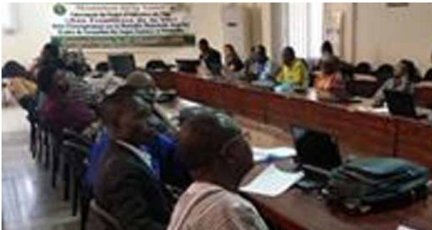
Lancement du projet.

L e lancement du Projet d'utilisation du film «Aux Frontières de la vie» est intervenu le jeudi 08 décembre 2016 à Ouagadougou. C'est le ministère de la Santé en collaboration avec l'Institut de santé globale de l'Université de Genève qui ont procédé au lancement dudit projet.