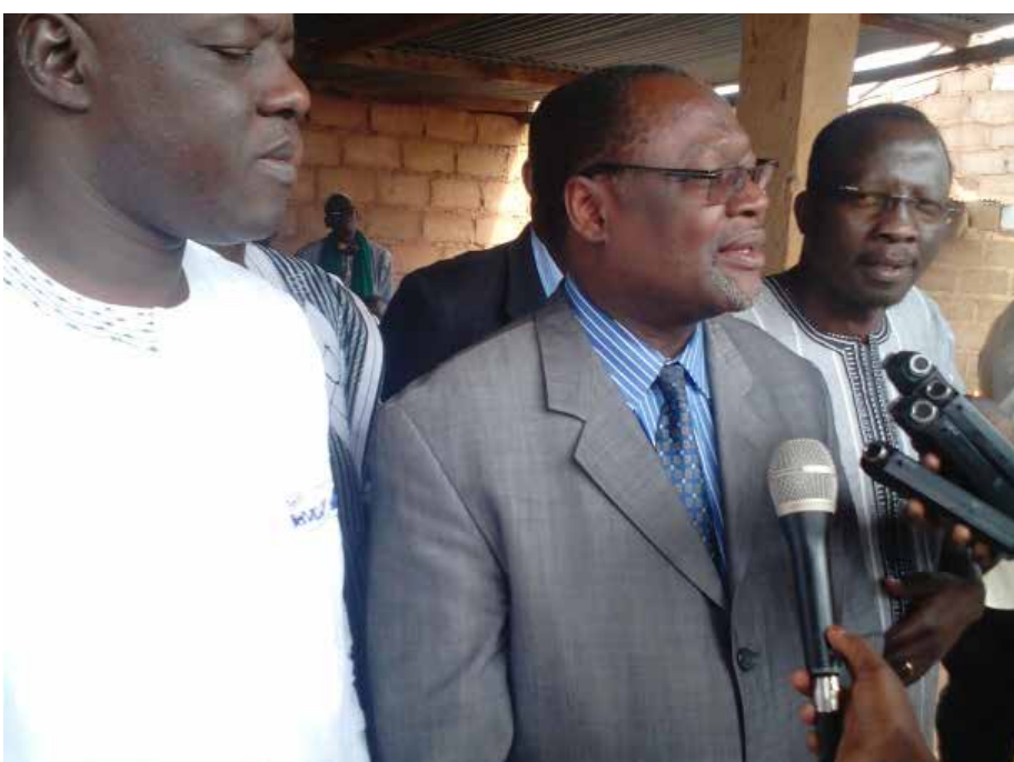
Le Président de la CODER Ablassé OUEDRAOGO face aux journalistes.