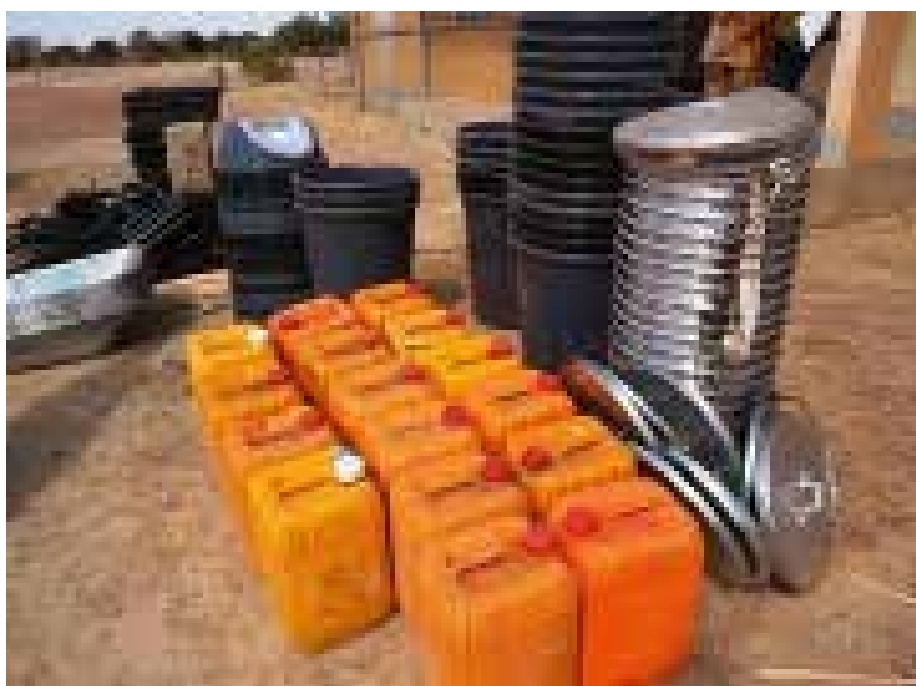
Don de matériel.