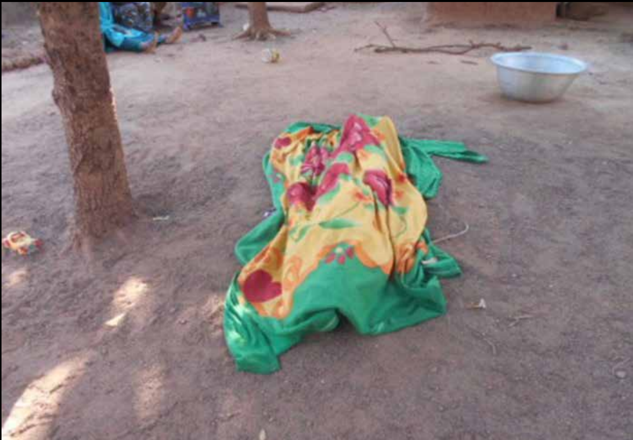
Corps de Awa YARO couvert.