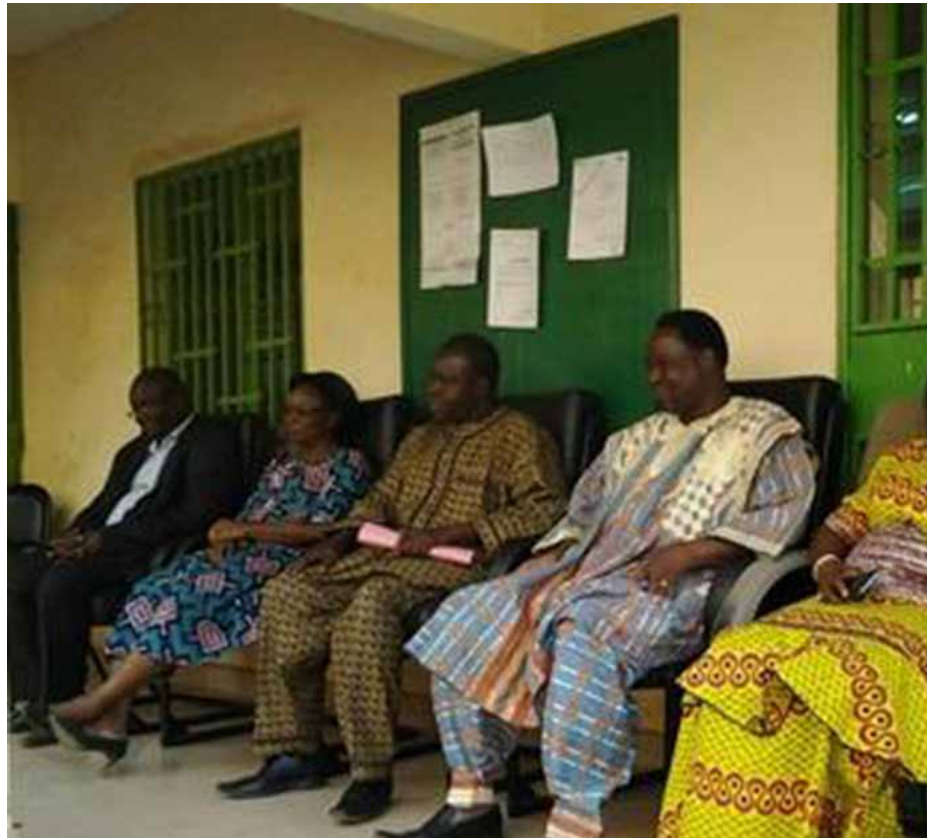
Le personnel du Service d'information du gouvernement(SIG).

De quoi rendre fier le coordonnateur du SIG et lui faire dire à ses collaborateurs : « vous êtes tous et toutes des solutions et j'en suis fier de vous avoir à mes côtés et fier de vous tout simplement ».