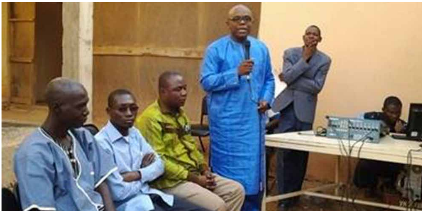
Le ministre de la Communication et des relations avec le Parlement, porte-parole du gouvernement, Rémis Fulgance Dandjinou prononçant son discours.