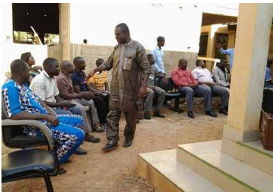
Le personnel du Service d'information du gouvernement(SIG).

L e personnel du Service d'information du gouvernement(SIG) a organisé une cérémonie de présentation de vœux, ce vendredi 27 janvier 2017, à Ouagadougou, en présence du ministre de la Communication et des relations avec le Parlement, porte-parole du gouvernement, Rémis Fulgance Dandjinou.