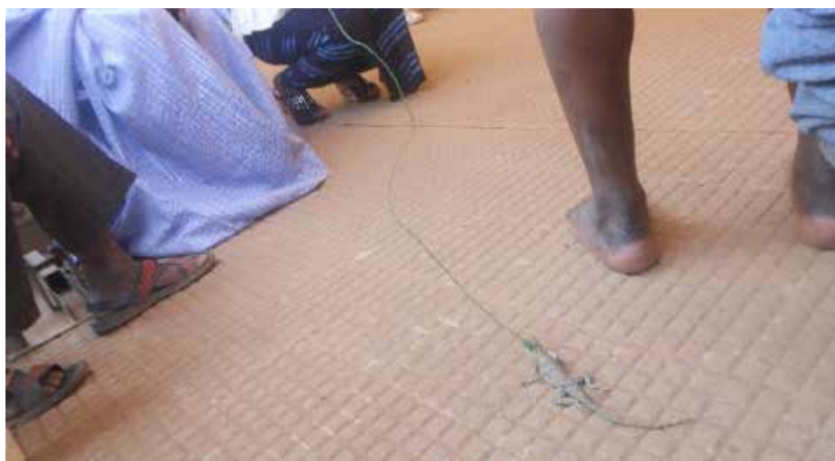
Un «boeuf» en guise de cadeau au Mogho Naaba de la part des samo.

Mogho. Ceux-ci ont reçu comme billets de banques des papiers bien découpés. A la fin de la cérémonie nous avons tendu notre micro à la présidente de Sitei Lawa qui nous a fait la genèse de l'association.