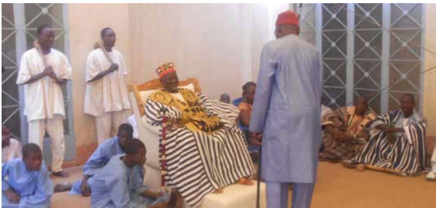
Le chef de canton des samo face au Mogho Naaba.

L'association Sitoi Lawa qui signifie en langue San, laisse tout à Dieu est une Association qui regroupe les femmes Samo du secteur informel. En rappel elle a été créée le 11 Février 2007, d'où son 10 ème anniversaire aujourd'hui. Ce Samedi 11 Février, l'Association s'est rendue au palais du Mogho Naaba dans le cadre de la célébration des 24 heures du Rakiré ou parenté à plaisanterie. L'objectif de cette célébration est de sauvegarder les valeurs culturelles aux fins de renforcer la cohésion sociale entre les communautés par le jeu des alliances, gage d'interprétation et de paix sociale dans notre pays.