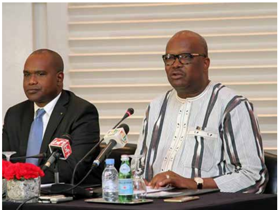
Le Président du Faso et le ministre des affaires étrangères.