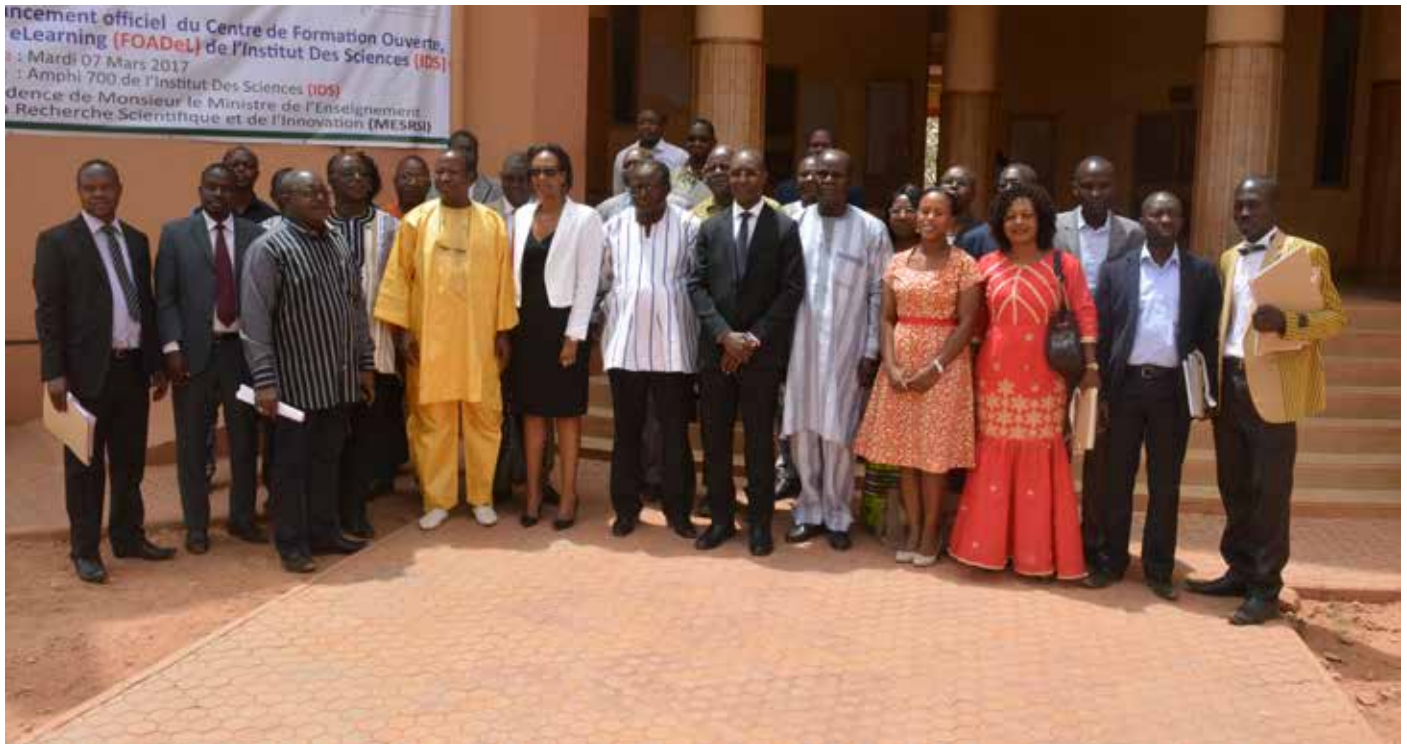
La photo de famille.

les détails du financement, soit au total 135 millions de francs CFA, en raison de 45 millions sur fonds propres de l'institut et de 90 millions de la part de l'UVA à travers la BAD.