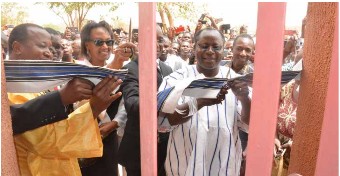
Coupure du ruban.