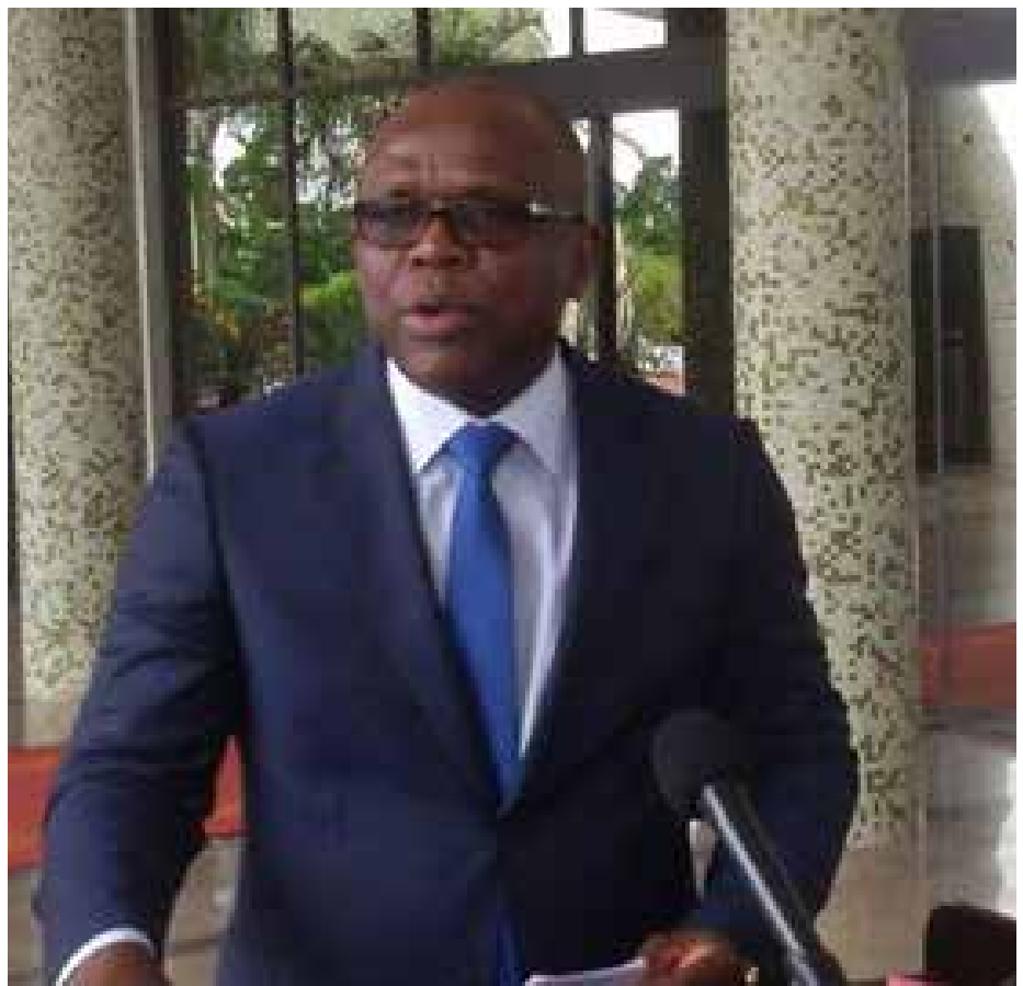
Le porte-parole du gouvernement.

-Au titre du ministère des mines et carrières, le ministre en charge de la communication a souligné que le conseil a examiné les recommandations du rapport de la commission d'enquête parlementaire sur la gestion des titres miniers et sur la responsabilité des entreprises minières au Burkina Faso. Il y a onze recommandations qui sont adressées au ministère en charge des mines et trente six, qui sont