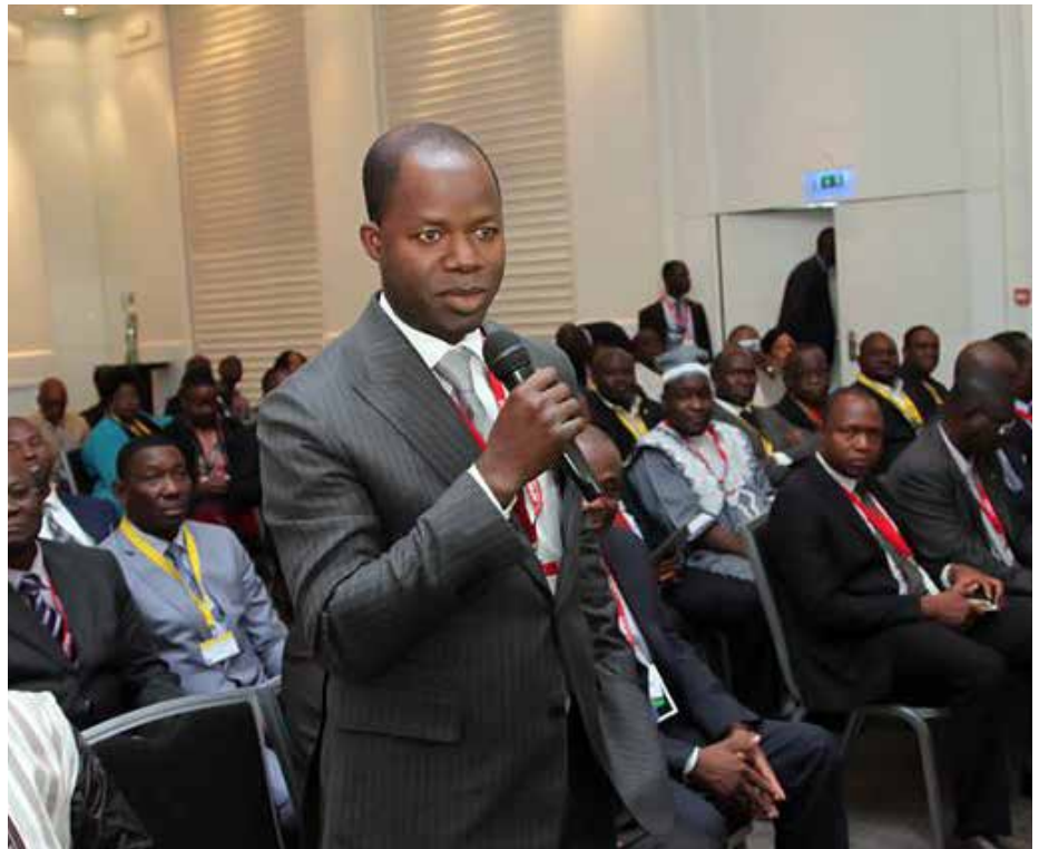
Un opérateur économique.

La Direction de la Communication de la Présidence du Faso