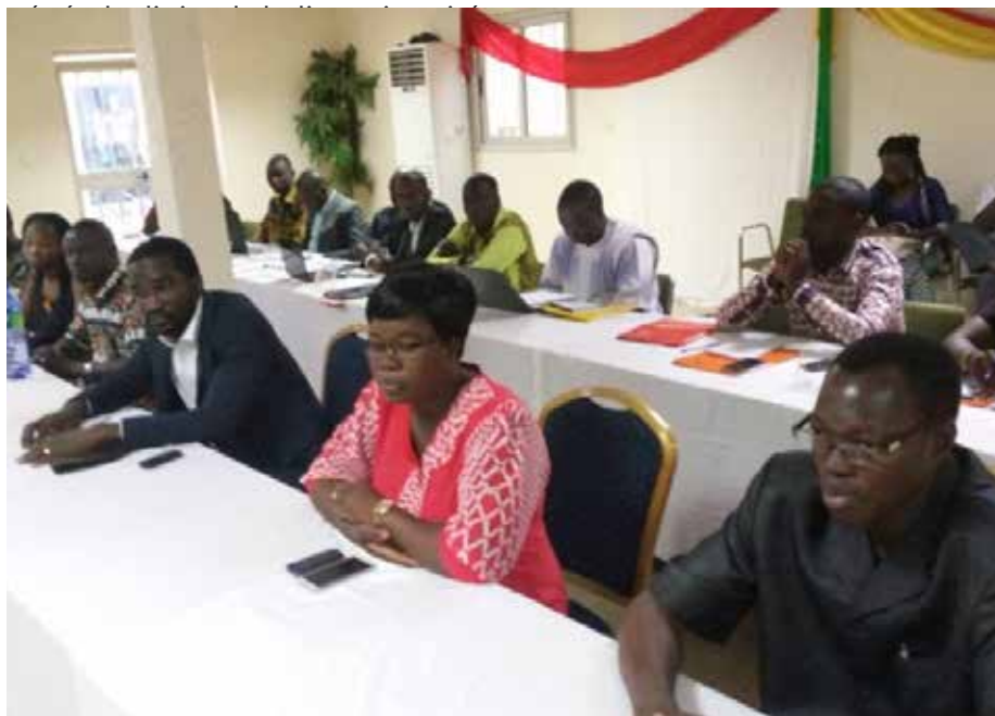
La formation est dispensée par le cabinet Excelle Consulting.