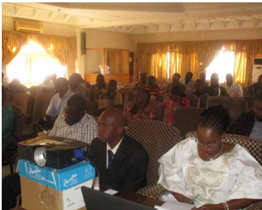
Les acteurs de la presse privée.

En rappel, la création du Fonds d'appui à la presse privée par décret N°2015-1334/PRES-TRANS/PM/MEF/MC-CNT du 17 novembre 2015 s'inscrit dans le cadre du renforcement de la gouvernance du secteur de la presse privée et des capacités techniques et marginales des acteurs. Il est placé sous la tutelle financière du ministère de l'Economie, des finances et du développement, sous la tutelle technique du ministère de la Communication et des relations avec le parlement.