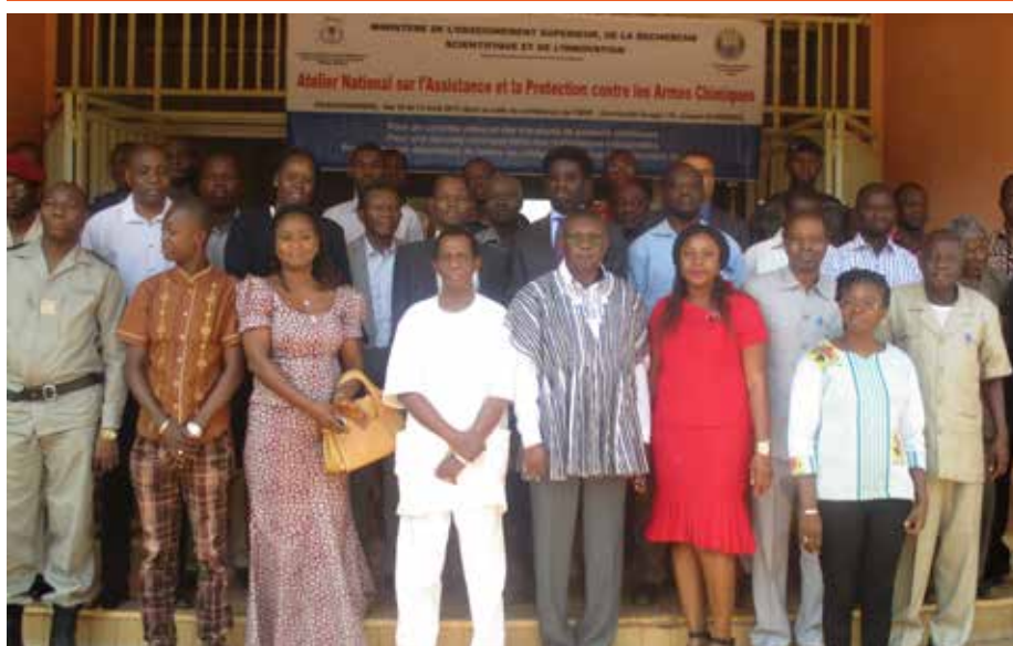
Photo de famille.

chimique qui a fait 72 morts la semaine dernière en Syrie. Et ce cas syrien doit servir de leçon selon les panelistes. Cet atelier qui refermera ses portes le jeudi 13 avril devra permettre aux différents participants d'avoir des positions qui ouvrent de grandes perspectives pour une réaction