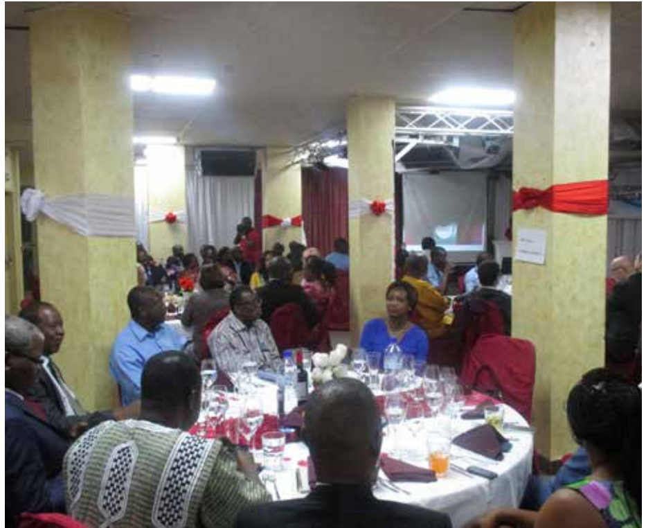
Les invités à ce dîner-débat.