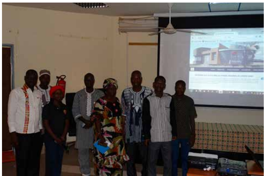
Le site web lancé se veut une vitrine de la région du Centre-Nord.

matière de communication. les partenaires s'intéresseront davantage aux collectivités territoriales du Centre-Nord. Question épineuse de la recherche de financement des plans de développement des collectivités.