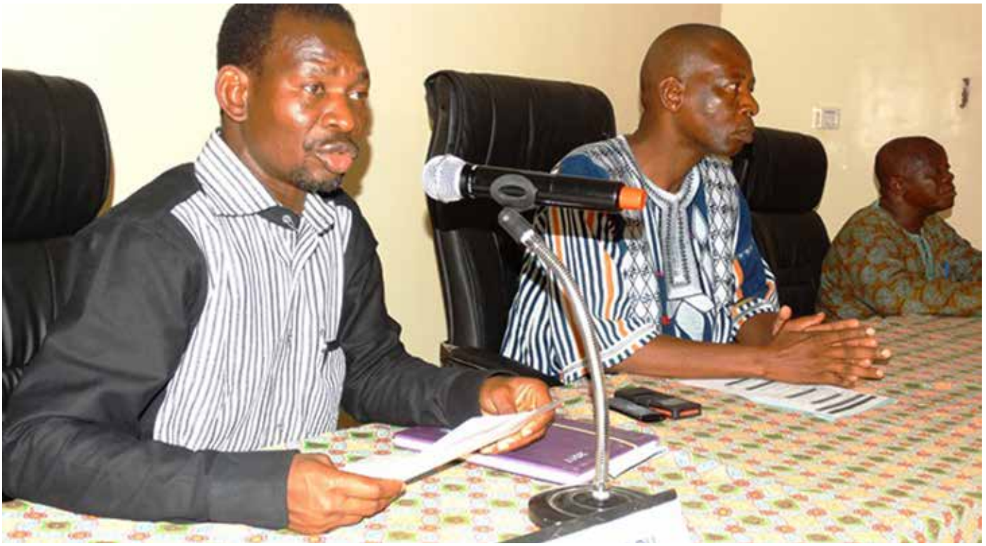
Le présidium à l'ouverture des échanges.

L e conseil régional du Centre-Nord a organisé ce vendredi 07 avril 2017 à Kaya, un atelier de plaidoyer avec les maires des communes de la région. Tenu grâce à l'appui financier de l'ONG ATAD et placée sous la présidence de madame le gouverneur de la région, cette rencontre a permis à l'organe dirigeant du conseil régional de dégager les besoins urgents dans les secteurs sensibles et de trouver des stratégies consensuelles de mobilisation