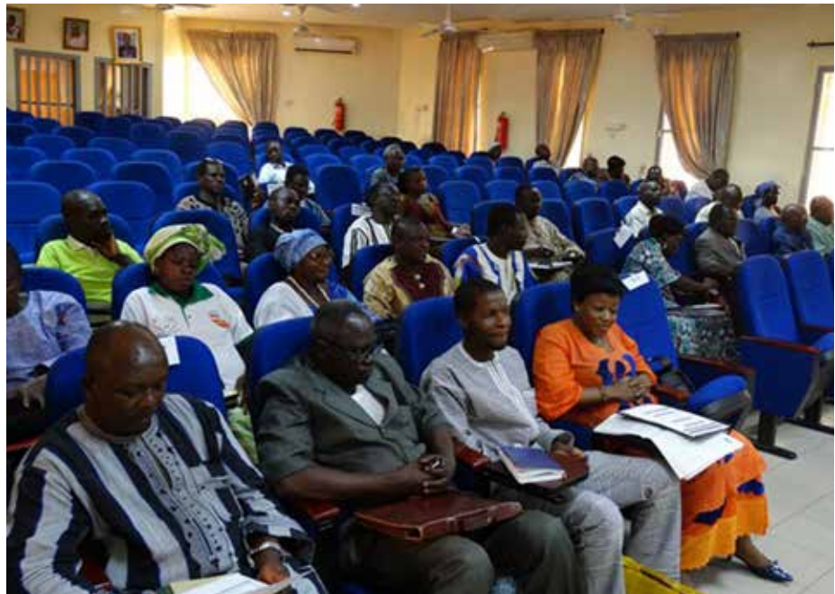
Les participants ont apprécié la démarche du Conseil Régional.

L'atelier de plaidoyer a été également l'occasion pour le conseil régional de lancer officiellement son site web. Le www.centrenord-bf.org construit grâce à l'appui technique de l'association Yam-Pukri, se veut une vitrine pour la collectivité région et pour l'ensemble des 28 communes. Les élus ont été invités à se l'approprier pour une meilleure visibilité de leurs actions aux bénéficiaires des populations de plus en plus exigeantes en