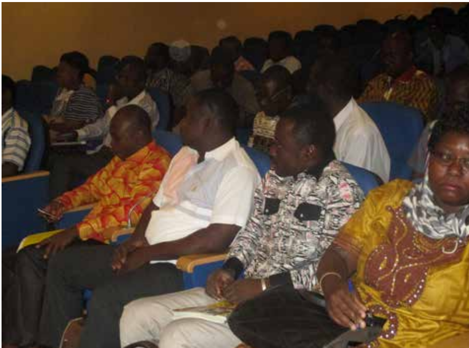
L'atelier réunit des journalistes et les représentants des structures pour la promotion des droits des personnes handicapées au Burkina Faso.