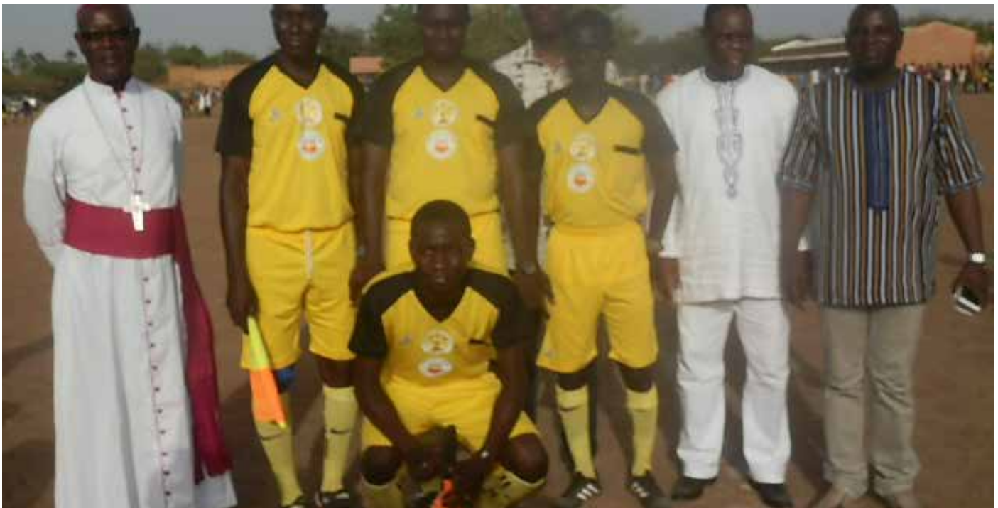
Les autorités à la cérémonie avec les juges de touches.