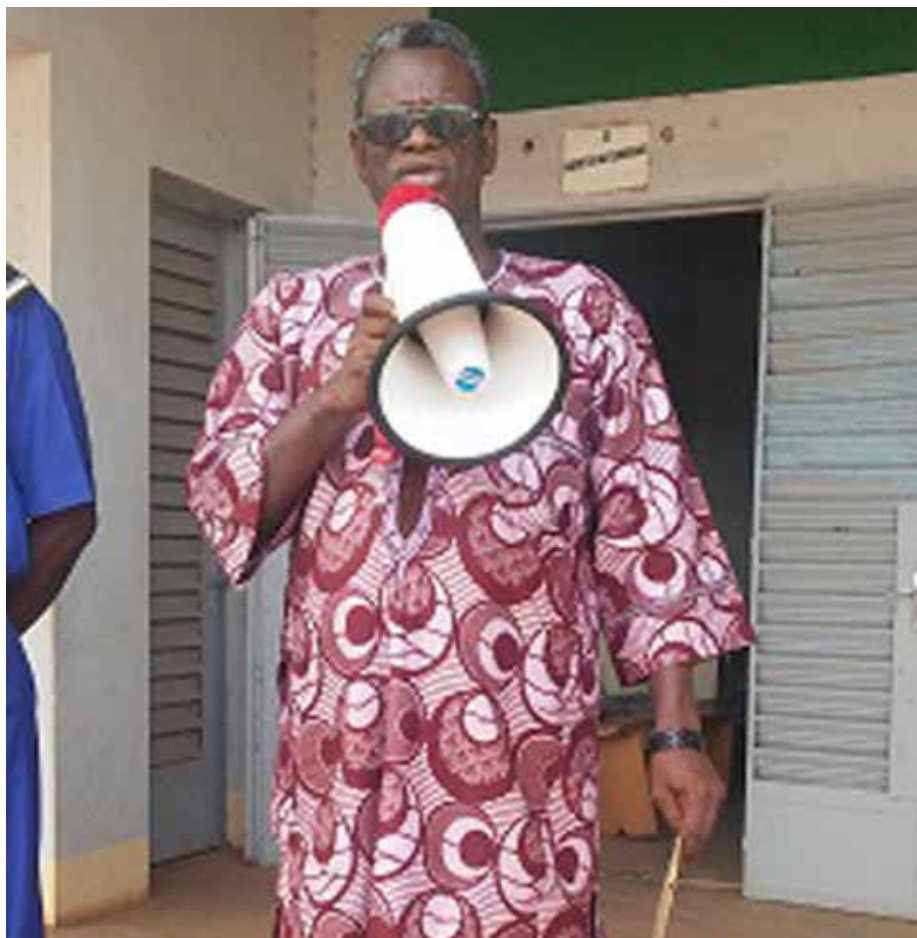
Le Haut commissaire.

Pour TONE, pour redresser la pente, les devanciers doivent s'y mettre. « Les aînés doivent donner de bons exemples en prenant part aux rencontres et aux luttes syndicales. L'école syndicale est permanente et ambiante, malheureusement pas de diplôme. Donc c'est à nous de donner l'exemple, en ayant à l'esprit que nous sommes tous des prolétaires et menons un même combat ». Pour terminer, il a félicité les organisateurs