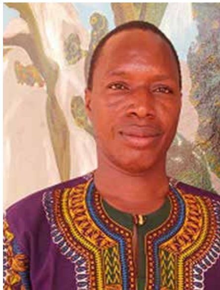
DEMBELE S GUY.

transparence et une équité dans le mouvement du personnel, le