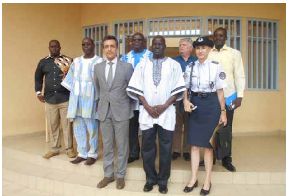
Photo de famille sur la devanture du Gouvernorat.