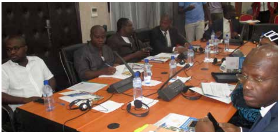
Les participants venus des 15 Etats membres de la CEDEAO.