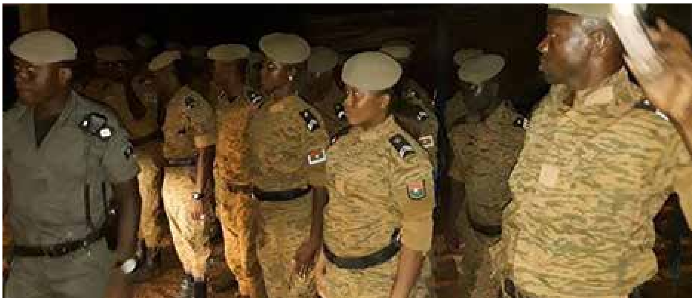
Simon Compaoré aux éléments de L'Escadron de Gendarmerie de Koudougou.

S imon Compaoré aux éléments de L'Escadron de Gendarmerie de Koudougou : <<On est venu vous saluer au nom du gouvernement pour ce que vous faites. Les rapports qui nous parviennent sont satisfaisants et nous vous encourageons à continuer dans ce sens, malgré la vétusté des moyens>>.