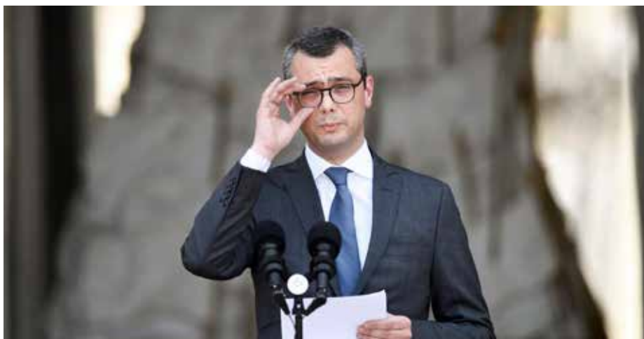
Le Premier ministre de la France, Edouard Philippe.

L a liste du gouvernement du Premier ministre Edouard Philippe a été dévoilée ce mercredi 17 mai, à 15 h. Les nominations ont été retardées de 24 heures, le temps de vérifier la situation fiscale et l'absence de conflits d'intérêts de chacun. L'équipe de vingt-deux ministres est donc a priori « irréprochable », selon la formule de l'Élysée. Le nouveau chef de l'État a pu rassembler des gens « de droite et de gauche », comme promis.