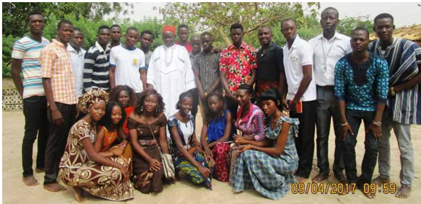
Photo de famille avec sa majesté NabaGuigmpolé Dima de Zoungatenga.

C' est sous le thème : « Bagrépole, croissance et souveraineté alimentaire », que le club des étudiants en Analyse et Politique Economiques (APE) a organisé une sortie d'étude et de visite du pôle de croissance de Bagré dans la région du Centre-Est. Du 07 au 10 avril 2017, plusieurs visites se sont succédé dans le dit site avant de rencontrer les acteurs de Bagrépole ainsi que d'éminentes personnalités de la région du Centre-Est. Dans l'ensemble, les étudiants ont pu apprécier les énormes potentialités du Centre-Est et