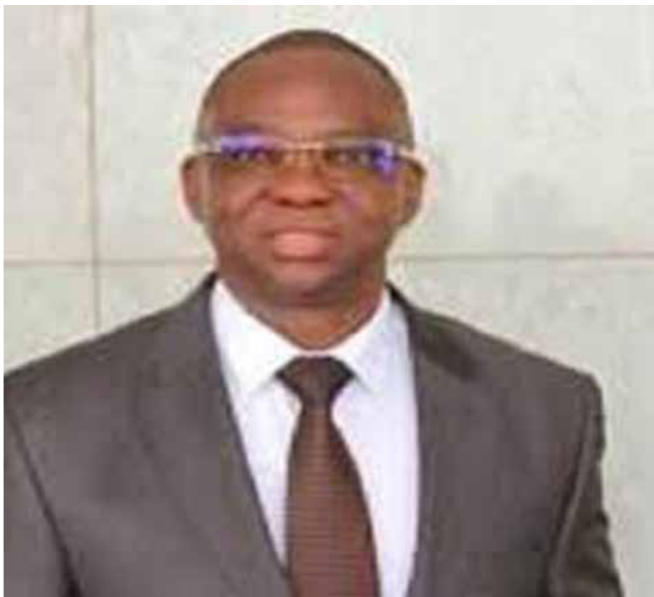
Ministre de la Santé, Nicolas Méda.

I. GENERALITES Les schistosomes ou bilharzioses sont des maladies parasitaires dues à la présence de vers plats (schistosoma) logées dans les vaisseaux sanguins. D'après l'OMS, la schistosomiase (ou bilharziose) est l'une des principales maladies transmissibles ayant des répercussions sanitaires et socio-économiques majeures dans 76 pays en voie de développement où elle constitue un