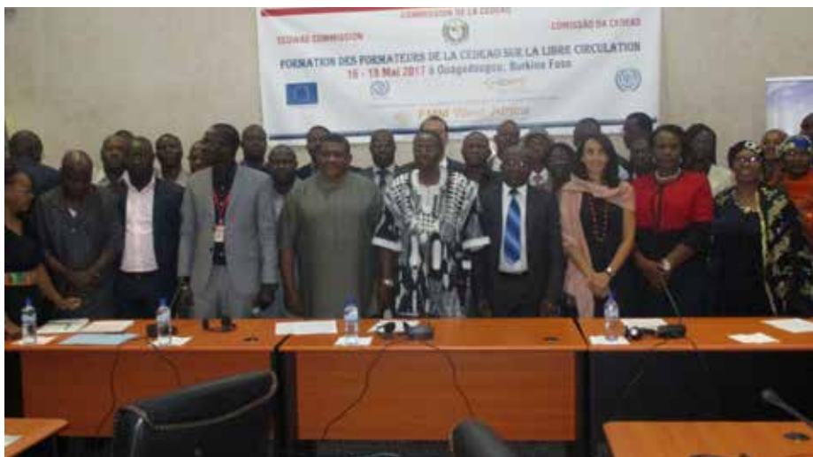
Une photo de famille a permis d'immortaliser l'évènement.

Pour le ministre de la fonction publique, Clément Sawadogo « On ne peut pas aujourd'hui dissocier le phénomène migratoire de l'histoire de nos Etats. Cependant, différents obstacles empêchent la libre circulation effective des personnes et des biens. Ces obstacles doivent être levés. Du point de vue de la législation, il n'y a pas d'obstacles au Burkina Faso pour l'installation de personnes des autres pays de la CEDEAO qui souhaitent s'y installer. Pour lever ces obstacles, cette formation s'inscrit dans la