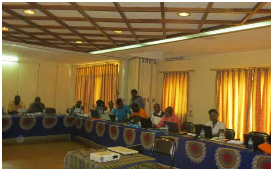
Cet atelier vise à renforcer les compétences des dirigeants et accompagnants des mutuelles en vue de l'accomplissement de leurs rôles politiques et techniques au sein des structures mutualistes.

71 nouvelles mutuelles doivent être couvertes en 2017. « L'ambition de l'Association est d'arriver à couvrir 300 communes du Burkina en mutuelles », l'a