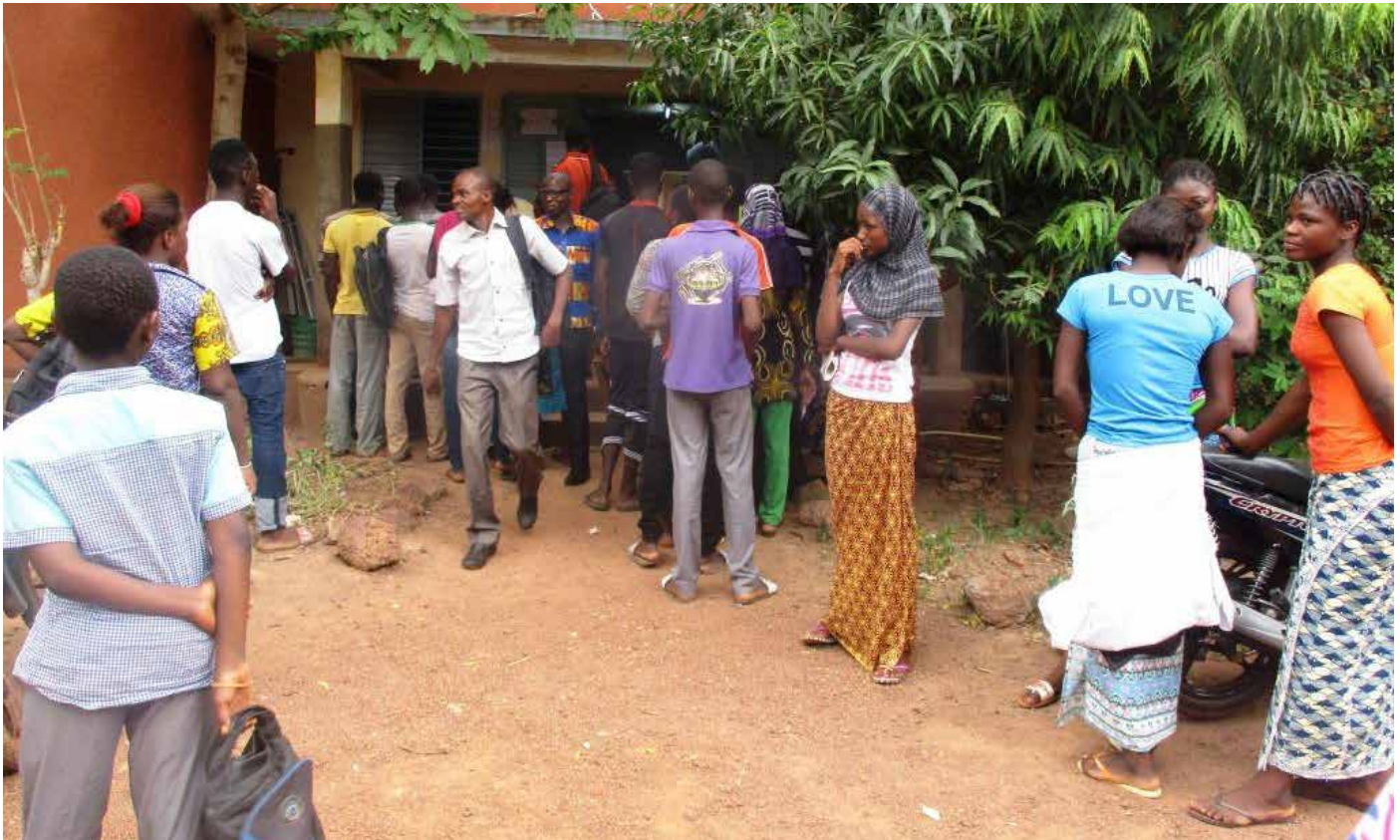
Candidats à la récupération de leurs attestations et relevés

D ébutée le 1 er juin 2017, l'administration des épreuves du BEPC se sont achevées ce 14 juin dans le Boulkièmdé. Tout au long de ces jours, les candidats se sont lancés tant bien que mal à la conquête de leur diplôme du premier cycle. Entre pleurs et des cris de joie ou encore de silence stoïque, chacun des candidats vivait à sa manière ses résultats à chaud et les différents sentiments pouvaient se lire sur