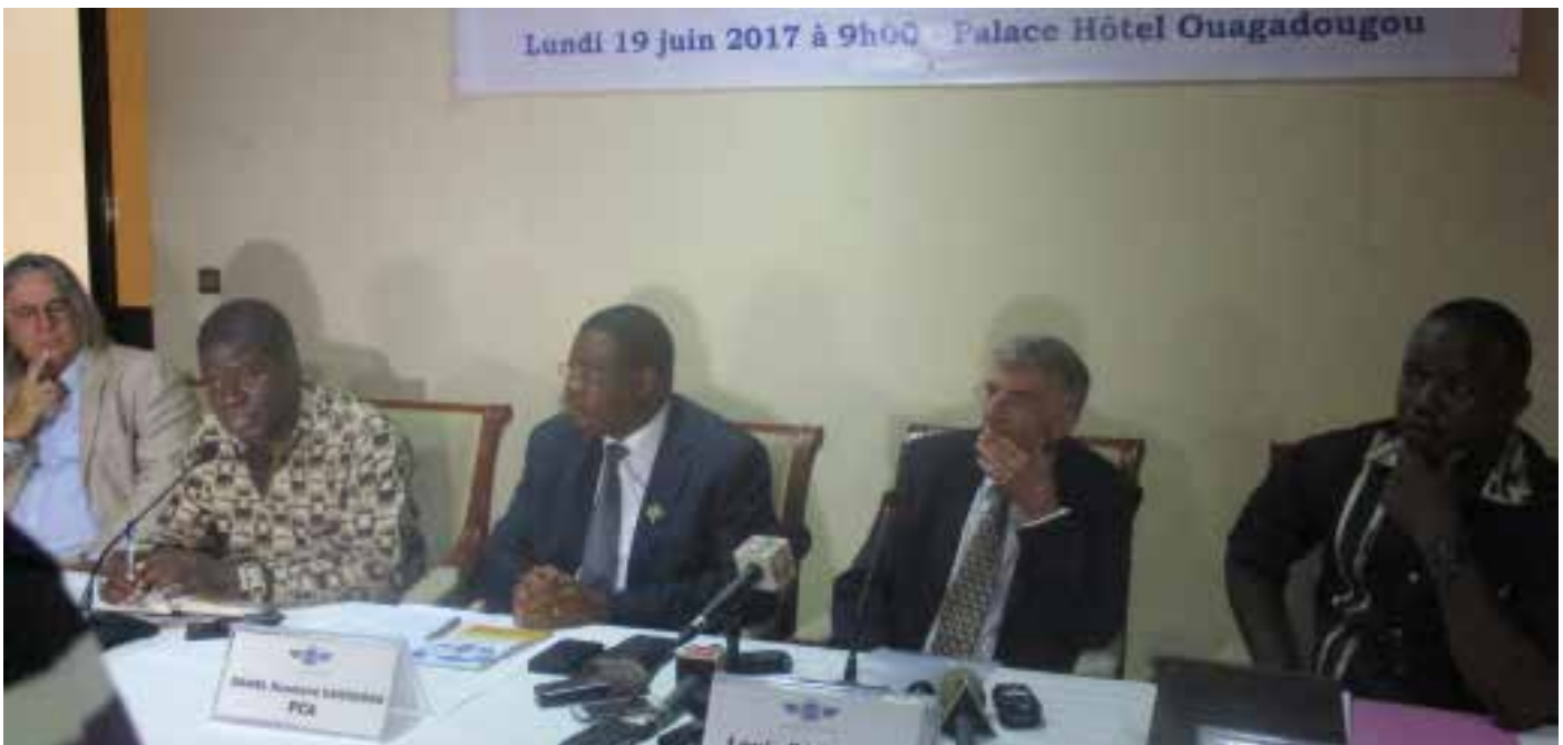
Les pilotes et les hotesses de AIR SARADA.

U ne nouvelle compagnie aérienne vient de voir le jour au Pays des Hommes intègres.