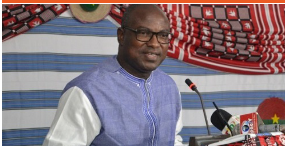
Eric Bougouma, ministre des infrastructures