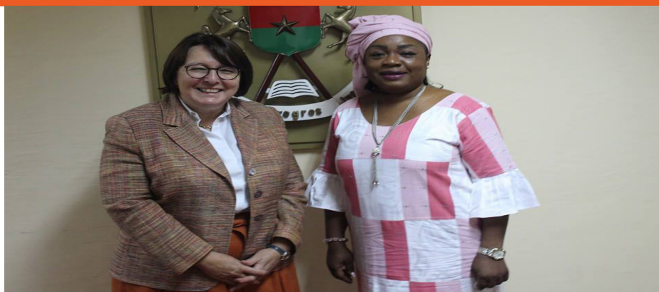
Une photo des deux protagonistes