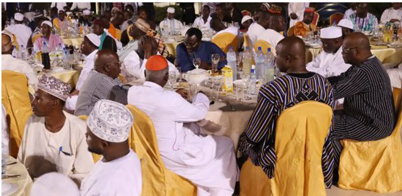
cérémonie de rupture collective du jeûne à la Présidence du Faso