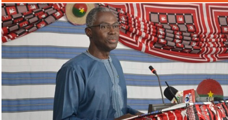
Le ministre Jean-Martin Coulibaly de l'éducation nationale et de l'alphabétisation