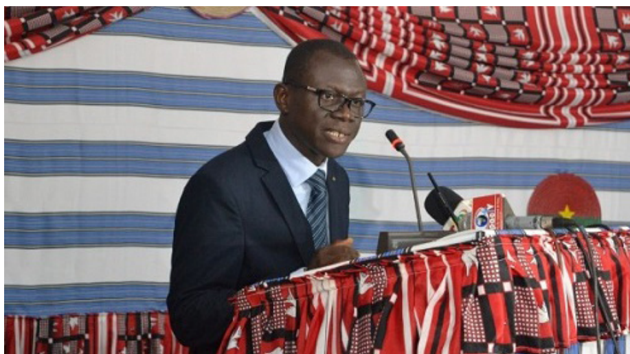
Le ministre en charge de la justice, René Bagoro