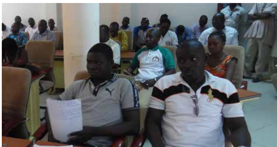
les contrôleurs/Inspecteurs du travail.

Aussi, à en croire le syndicat, le manque de moyens dont les agents du ministère sont confrontés est tout simplement handicapant. Pour preuve, les directions régionales n'auraient même pas de locaux. Quant aux moyens de déplacement, ils déplorent le fait que la direction du Centre qui regroupe au moins 80 000 entreprises ne dispose que d'un seul véhicule de contrôle. Ce qui constitue un obstacle rédhibitoire dans l'exécution de leurs missions de contrôle et donc de prévention de crises. C'est ainsi qu'ils estiment qu'avec un peu plus de moyens, ils