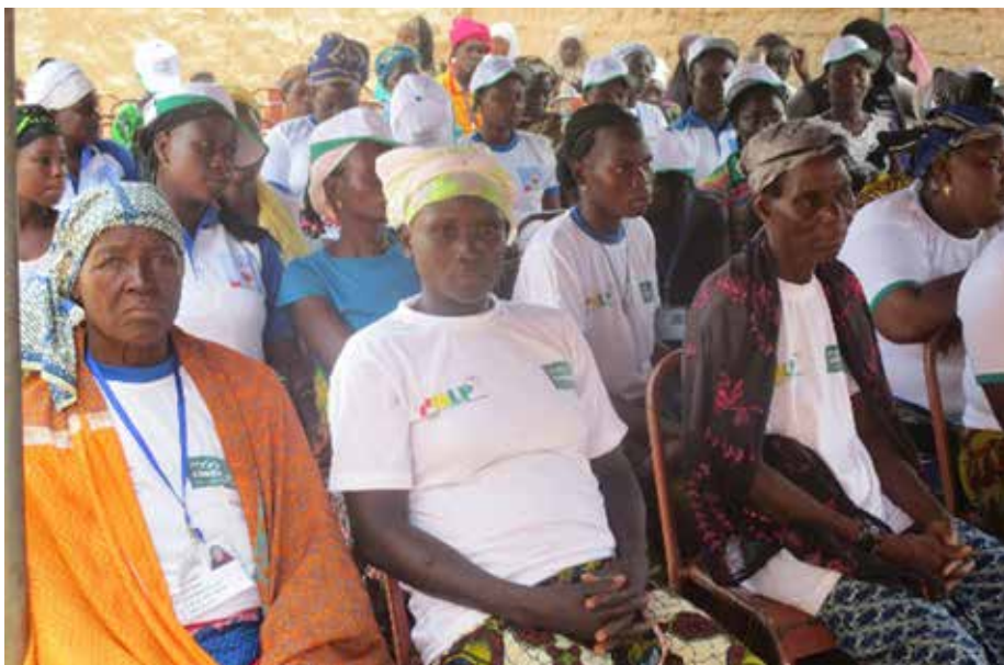
Quant aux participantes, elles disent avoir bien compris le message du conférencier et prennent l'engagement de bien nettoyer leur maison et de dormir chaque jour sous une moustiquaire.

Cette séance de sensibilisation s'inscrit dans le cadre du plan d'action prioritaire 2017 de l'A.F.U.D.E. L'association entend mener des séances de plantations d'arbre dans les mois à venir mais, d'ores et déjà une journée de salubrité est prévue ce dimanche 9 juillet 2017. En rappel, l'A.F.U.D.E avait aussi organisé une journée de sensibilisation avec l'aide de