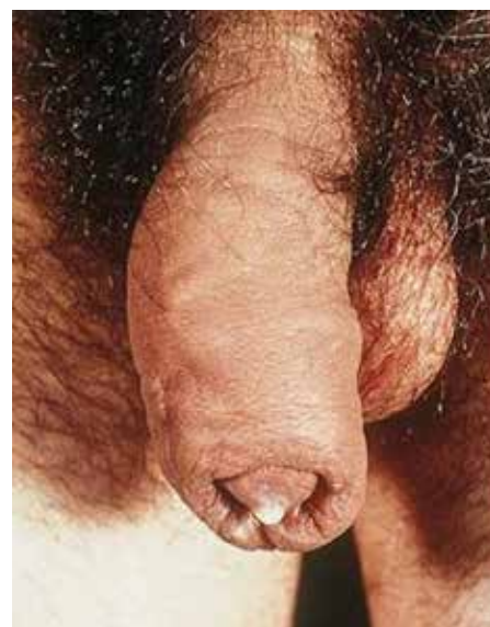
Émission de pus par le méat urinaire ; signe d'une gonorrhée chez l'homme.

Le dépistage de la blennorragie peut se faire soit par test d'urine, soit pas prélèvement de la région