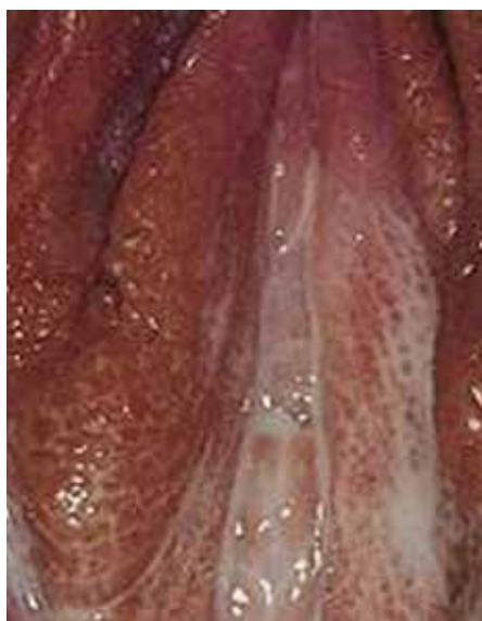
Gonorrhée chez la femme.

La période d'incubation est habituellement de 2 à 7 jours ; plus de 50 % des hommes et des femmes peuvent être des porteurs asymptomatiques de ces infections, qui sont le plus souvent localisées dans certaines