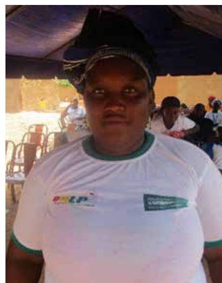
Une participante dit mettre en pratique ce qu'elle a appris.

C'est par une remise d'attestation de participation aux femmes que la cérémonie a pris fin.