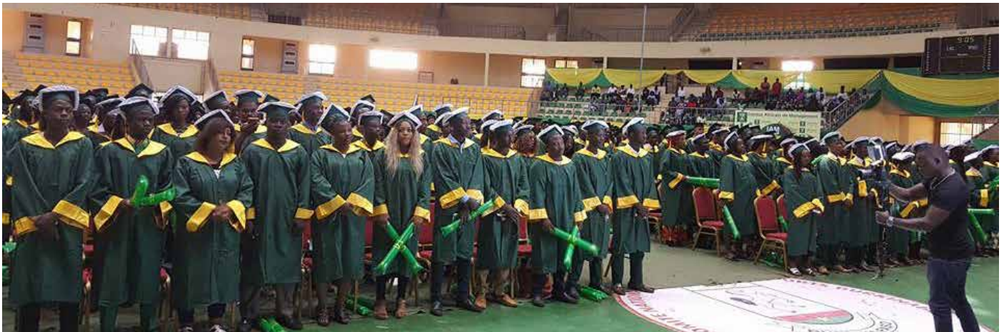
Sortie de promotion 2016/2017 des étudiants de L'Institut Africain de Management.

Le Ministre de l'Education nationale et de l'Alphabétisation, Jean Martin Coulibaly en compagnie du ministre en charge de l'Enseignement supérieur et de celui des Sports participe en cette matinée du 8 juillet 2017 à la sortie de promotion 2016/2017 des étudiants de L'Institut Africain de Management au Palais des Sports de Ouaga 2000.