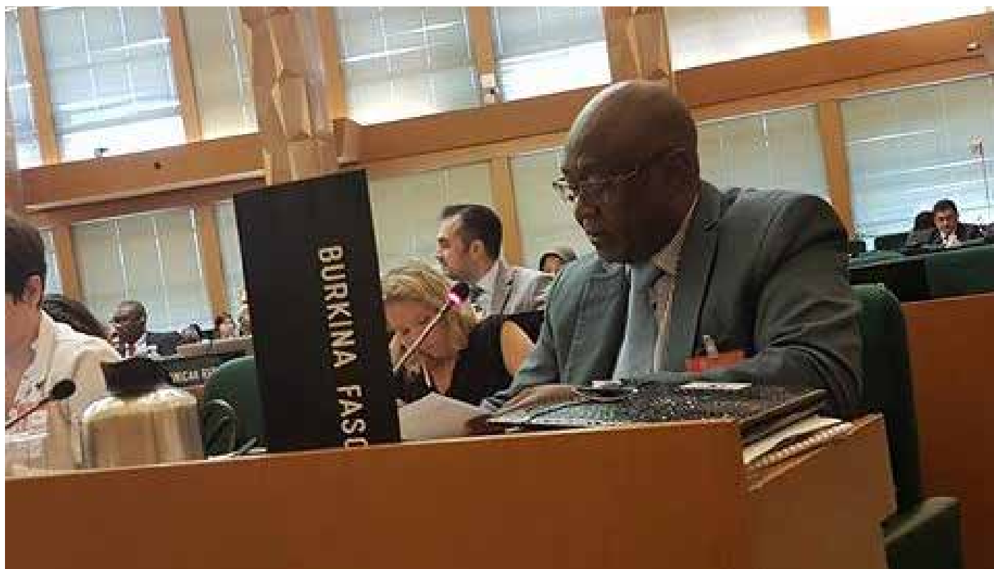
Le ministre Jacob OUEDRAOGO.

P articipant à la 40 e Conférence internationale de l'Organisation des Nations Unies pour l'Alimentation et l'Agriculture (FAO), le ministre Jacob OUEDRAOGO a réussi à faire adopter une motion par laquelle les membres de l'institution s'engagent à soumettre à l'Assemblée Générale des Nations Unies l'adoption d'une journée internationale