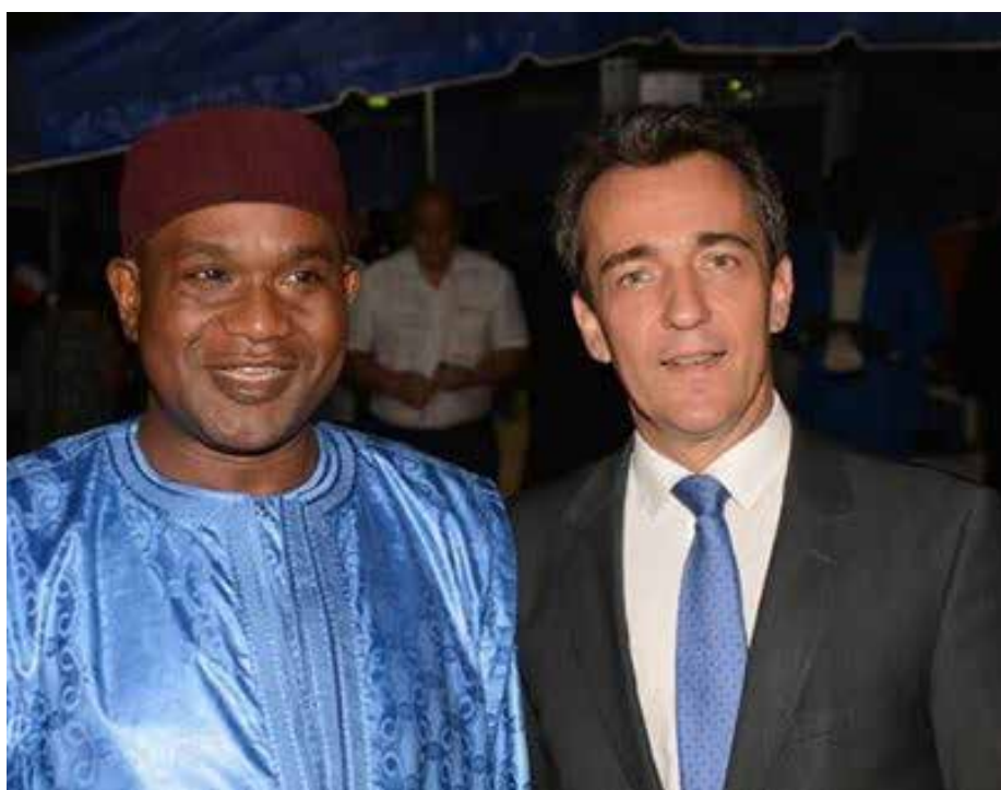
Le Ministre des Affaires étrangères de la Coopération et des Burkinabè de l'Extérieur S.E.M. Alpha Barry et L'ambassadeur de la France.