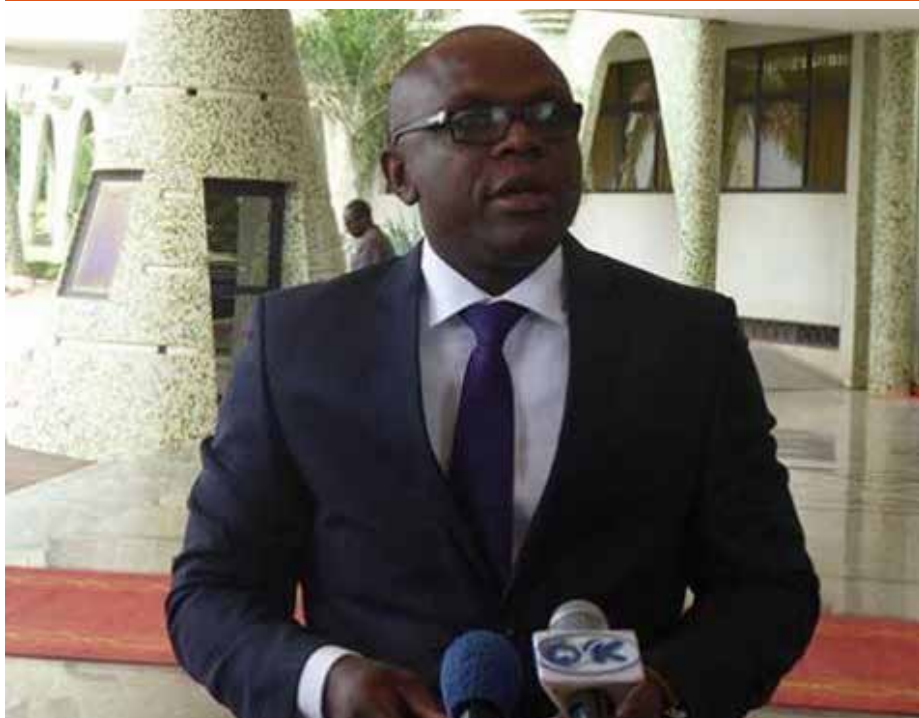
Le ministre de la communication.

S uite à l'appel du Syndicat Autonome des Agents du Trésor du Burkina (SATB) à un mouvement de débrayage général dans tous les services de la Direction Générale du Trésor et de la Comptabilité Publique (DGTCP), au motif d'une remise en cause par l'administration de la mise en œuvre du protocole d'accord signé le 29 mai 2017, le Gouvernement par la présente déclaration tient à apporter l'information juste aux travailleurs du Trésor public, aux usagers et à l'opinion nationale.