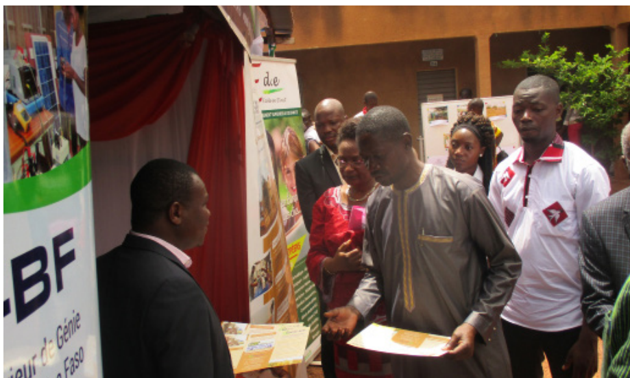
Le ministre Alkassoum Maïga visite les stands.