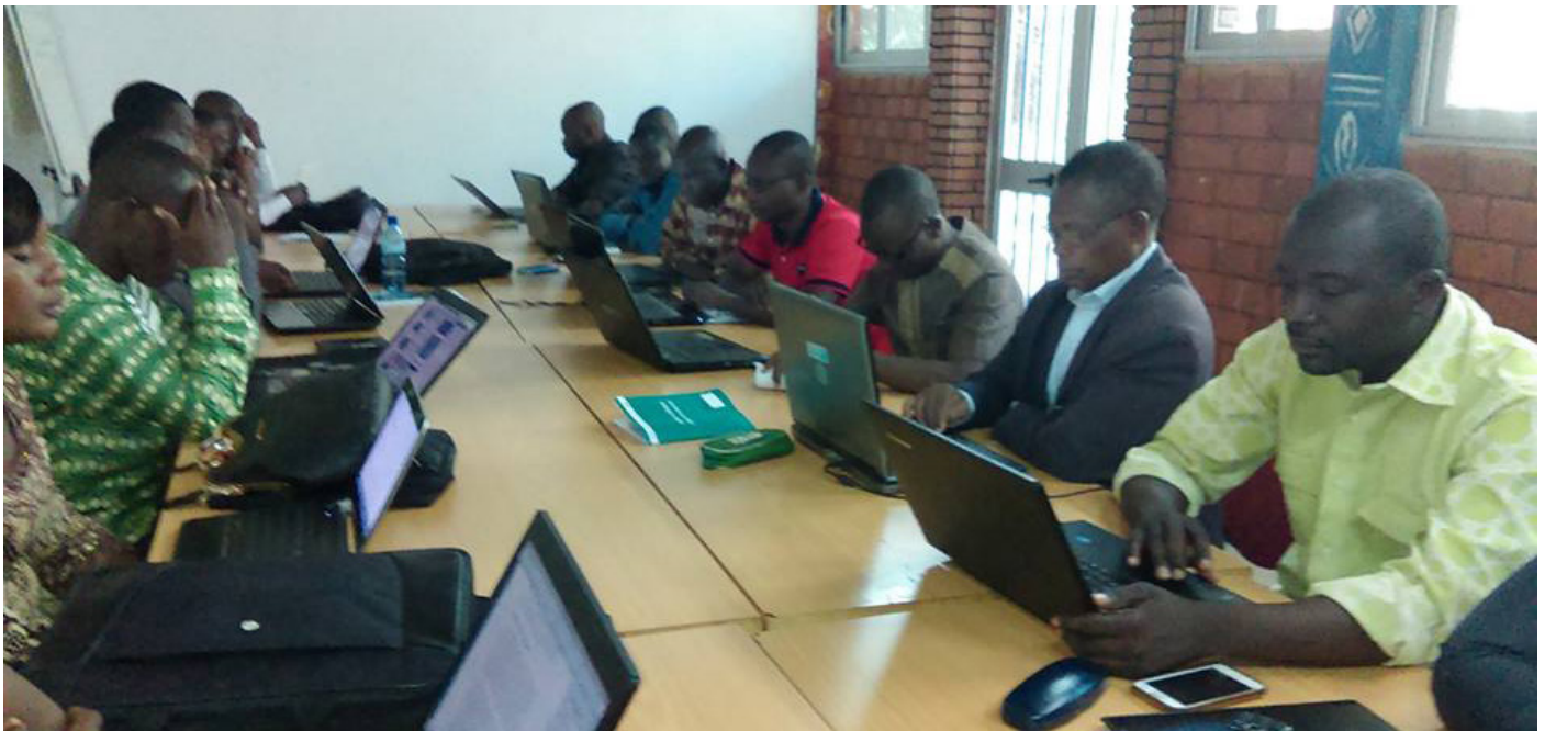
Le Comité multisectoriel.

L e Comité multisectoriel pour l'élaboration du rapport national pour le 3 e cycle de l'Examen périodique universel (EPU) tient à Koudougou, du 24 au 28 juillet 2017, une retraite de travail pour l'élaboration du projet dudit rapport. Ce rapport dressera la situation des droits humains au Burkina Faso et de la mise en œuvre des recommandations de l'EPU.