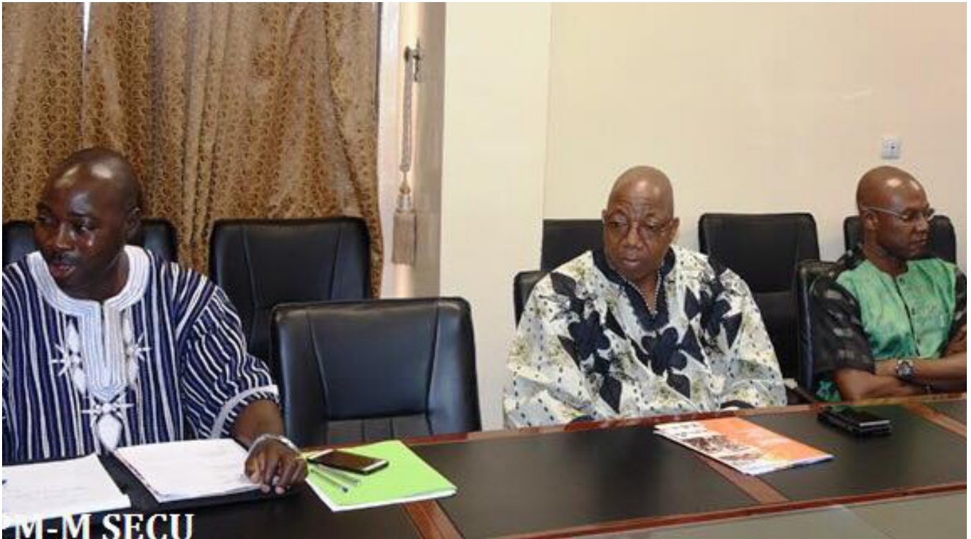
Le Comité de Pilotage (COMPIL) du Projet d'Appui au Renforcement de la Sécurité Intérieure au Burkina Faso (PARSIB).

L e Comité de Pilotage (COMPIL) du Projet d'Appui au Renforcement de la Sécurité Intérieure au Burkina Faso (PARSIB) s'est réuni le mardi 25 juillet 2017, sous la présidence de son premier responsable, Simon Compaoré, Ministre d'Etat, Ministre de la Sécurité. La rencontre a porté sur le bilan des activités menées par le projet et les résultats obtenus depuis son opérationnalisation en septembre 2016.