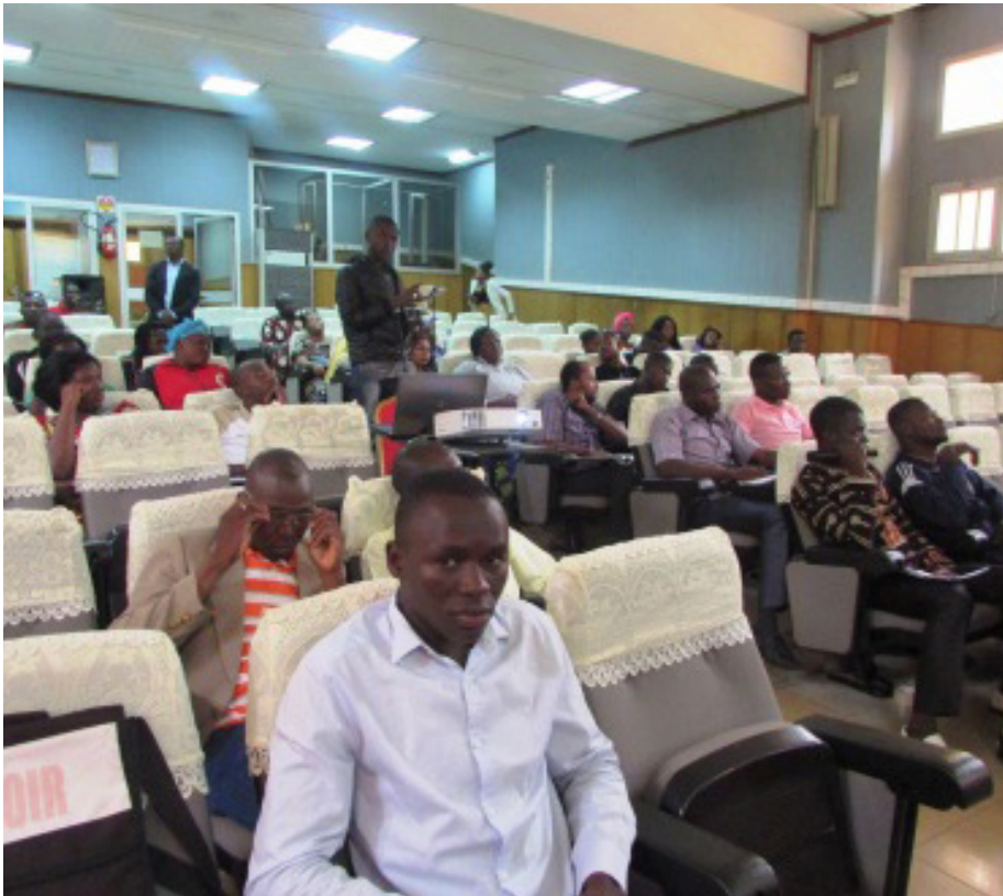
Les participants pendant leur formation en montage de projet.

C ette deuxième édition a connu la participation d'une centaine de jeunes venus de la région des Hauts-Bassins pour mener des réflexions autour de la question de gouvernance au Burkina Faso.